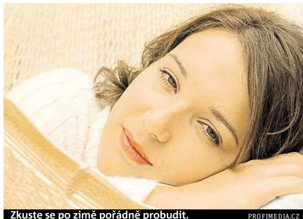
Zkuste se po zimě pořádně probudit.

Pokud tak už neděláte, naučte se ráno sprchovat. A na