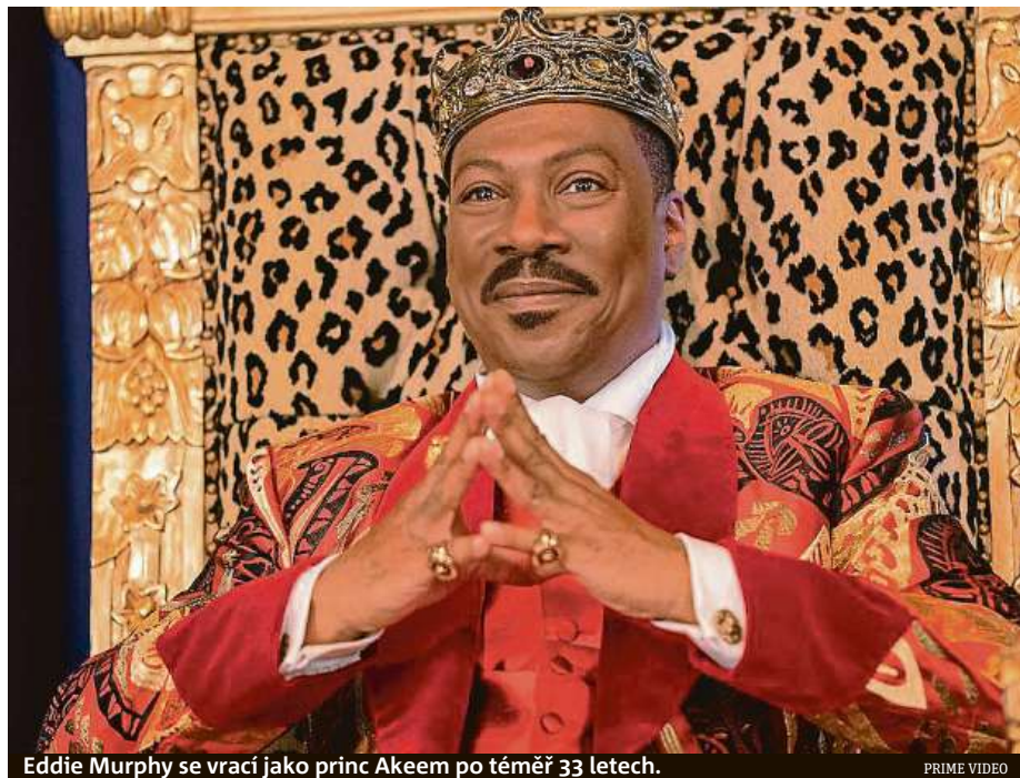
Eddie Murphy se vrací jako princ Akeem po téměř 33 letech.