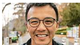
Oliver Le Que Zoo Praha