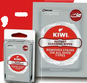
Čistící ubrousky na boty KIWI 4ks 2balení jen za 12,- Kč

K DOSTÁNÍ POUZE V OBCHODECH VÁŠ LEVNÝ NÁKUP