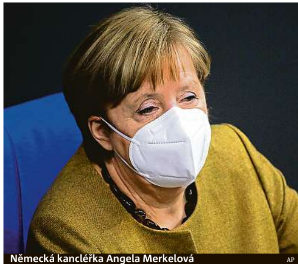
Německá kancléřka Angela Merkelová

Od pondělí se také mohou otevřít obchody v regionech, kde je sedmidenní incidence