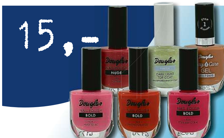
Lak na nehty Douglas mix odstínů 10ml jen za 15,- Kč