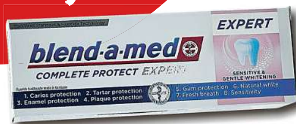
Zubní pasta blend a med EXPERT 50ml jen za 12,- Kč