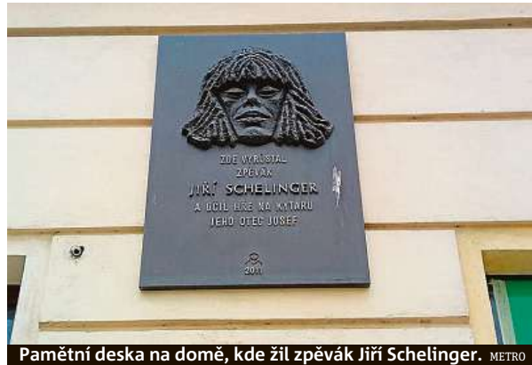
Pamětní deska na domě, kde žil zpěvák Jiří Schelinger.

Pan Schelinger, elegán v širokém klobouku – na ulici na sto metrů nepřehlédnutelná