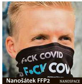
Nanošátek FFP2 NANOSPACE