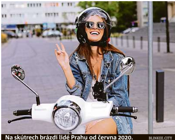
Na skútrech brázdí lidé Prahu od června 2020.

Firma se také, podobně jako její konkurence, přizpůsobila pandemii koronaviru. Kromě doplnění držáků na dezinfekci využila i poptávku po rozvozu jídla a pití, a tak si ke klasickým zákazníkům přibrala také kurýry. „Propojili jsme se s početnou skupinou kurýrů, kteří elektrovozítka blinkee.city využívají k co nejrychlejší dopravě jídla zá-