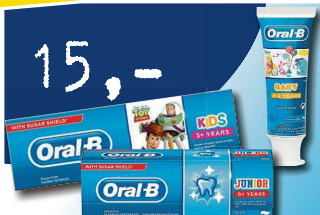
Zubní pasta pro děti ORAL B různé druhy 75ml jen za 15,- Kč