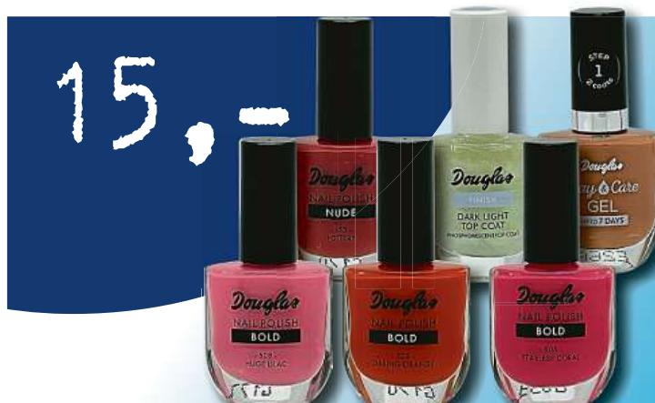
Lak na nehty Douglas mix odstínů 10ml jen za 15,- Kč