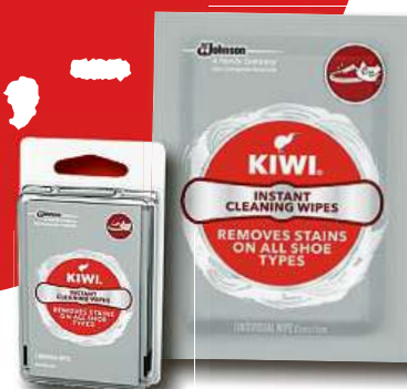
Čistící ubrousky na boty KIWI 4ks 2balení jen za 12,- Kč

K DOSTÁNÍ POUZE V OBCHODECH VÁŠ LEVNÝ NÁKUP