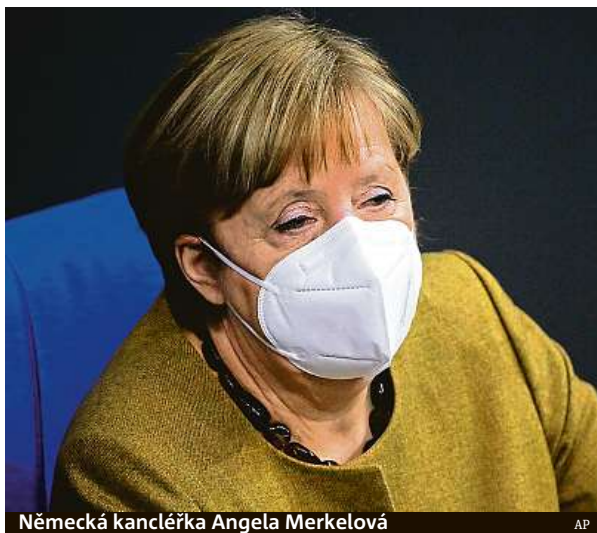
Německá kancléřka Angela Merkelová

Od pondělí se také mohou otevřít obchody v regionech, kde je sedmidenní incidence