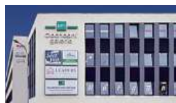
Obchodní galerie, Jihlava