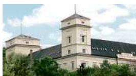
Zámek Račice, přestavba