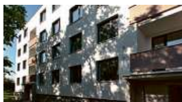
Bytový dům, Brno-Chrlice