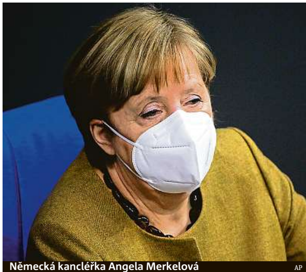
Německá kancléřka Angela Merkelová

Od pondělí se také mohou otevřít obchody v regionech, kde je sedmidenní incidence