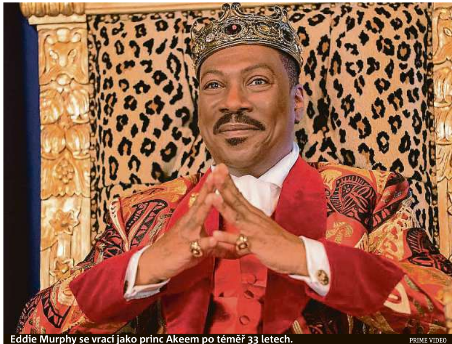
Eddie Murphy se vrací jako princ Akeem po téměř 33 letech.