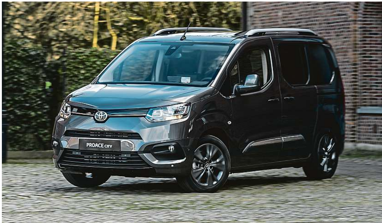
Toyota Proace City

Toyota Proace City přichází jak v užitečkové, tak osobní verzi. Znáť ji můžete i jako Citroën Berlingo nebo Peugeot Rifter či Opel Combo. Kromě designu kol, přední masky se znakem automobilky a detailů v interiéru jsou technicky i rozměrem identické, snad jen Peugeot Rifter sází uvnitř na svůj i-Cocpit zvednutý pod čelní sklo. Proace City se bude prodávat ve dvou provedeních – jako furgon alias plechovka čistě pro převážení nákladu, ale i jako osobní verze s dalším označením Verso. K dispozici budou obě verze ve dvou délkách, přičemž se liší i rozvor. Osobní verze může být až sedmimístná, a co se týče nákladového prostoru, Toyota se pyšní tím, že