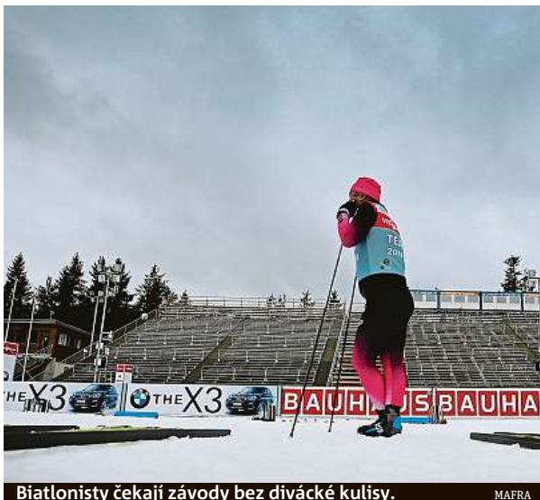
Biatlonisté čekají závody bez divácké kulisy.

Hokejová extraliga má před sebou ztížejší závěrečné kolo základní části, v němž budou tři týmy bojovat o udržení. Ředitel hokejové extrali-