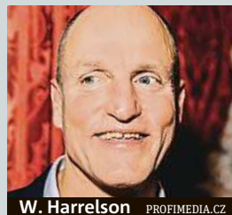
W. Harrelson

Na Febiofest přijede americký herec Woody Harrelson známý především rolí Larryho Flynta ve snímku Miloše Formana. Cenu Kristián za celoživotní přínos kinematografii obdrží také Iva Janžurová, Milan Lasica a režisér Hirokazu Koreeda. Hlavní část festivalu se uskuteční od 19. do 27. března v Praze.