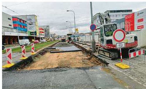
Oprava Poděbradské, březen 2020

*Údaje jsou předběžné, záleží bude na vydání povolení.