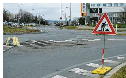
Novodvorská, zahájení oprav, 2020

Kromě velkých akcí jsou připraveny desítky menších staveb a oprav. V rámci dlouhodobé investiční akce „Zlepšení infrastruktury MHD“ jsou připraveny akce za necelých 94 mil. Kč, v jejichž rámci budou upraveny nebo vystavěny nové zastávky MHD. Do budování dalších záchytných parkovišť P+R chce Praha prostřednictvím TSK investovat 50 mil. Kč, na infrastrukturu pro chodce a cyklisty je plánuje vynaložit přes 163 mil. Kč, v rámci akce Praha bez bariér je alokována částka 59,3 mil. Kč a na akce BESIP necelých 197 mil. Kč.