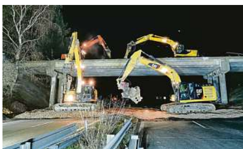
Bourání mostu na Zbraslavi 2019

Kromě velkých akcí jsou připraveny desítky menších staveb a oprav. V rámci dlouhodobé investiční akce „Zlepšení infrastruktury MHD“ jsou připraveny akce za necelých 94 mil. Kč, v jejichž rámci budou upraveny nebo vystavěny nové zastávky MHD. Do budování dalších záchytných parkovišť P+R chce Praha prostřednictvím TSK investovat 50 mil. Kč, na infrastrukturu pro chodce a cyklisty je plánuje vynaložit přes 163 mil. Kč, v rámci akce Praha bez bariér je alokována částka 59,3 mil. Kč a na akce BESIP necelých 197 mil. Kč.