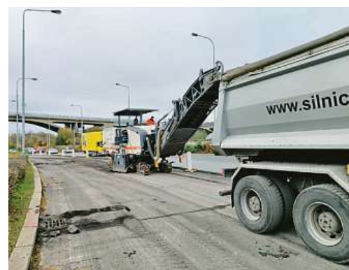
Opravy Modřanské budou pokračovat i v roce 2020