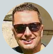
Martin Ponikelský Litvínov si koleduje o sestup už dlouho. Teď půjde dolů.