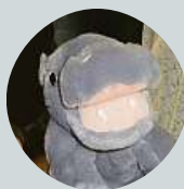
Michal Trávníček Mám vsazen dům na sestup Kladna.