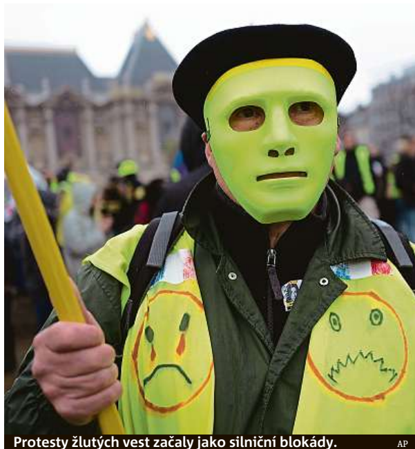
Protesty žlutých vest začaly jako silniční blokády.

Francouzi nespokojení s politikou vlády po celé zemi protestují od půlky listopadu, demonstrace začaly jako silniční blokády. IDNES.cz