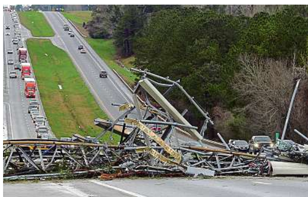
Tornádo strhlo i most přes dálnici poblíž Lee County.

Pravděpodobně úder tornáda si v americkém státě Alabama vyžádal nejméně 22 obětí včetně dětí a neupřesněný počet zraněných, z toho několik vážně.