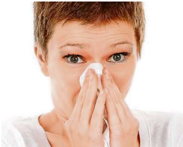
Podcenit nachlazení není moudré.

V České republice navíc osm zaměstnanců ze sta uvedlo, že se do práce vydají i v případě, že se nachlazení spojí s horečkou a bolestmi dýchacího aparátu.