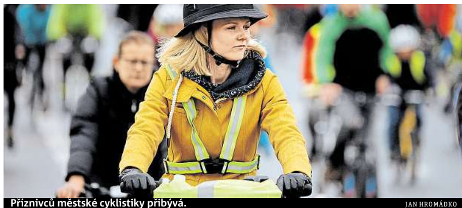
Příznivců městské cyklistiky přibývá.