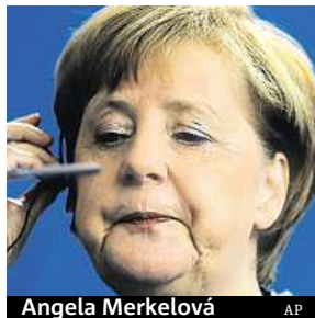
Angela Merkelová

Vnitrostranické referendum sociální demokracie dalo zelenou vstupu do vlády.