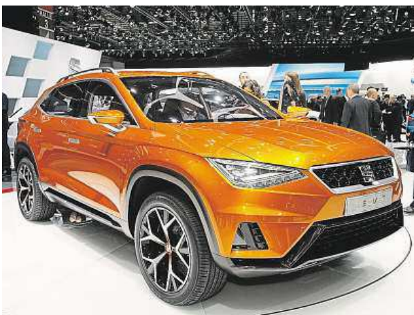
Seat vidí v konceptu 20V20 důležitý krok do budoucnosti.