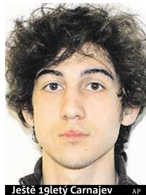
Ještě 19letý Carnajev

Je to vrah a zasluhuje smrt, tvrdí prokuratura. Nechal se zmanipulovat starším bratrem, uvěřil, že dělá správnou věc, byl jím zřejmě i zastrašován, tvrdí obhajoba. O to, že Džochar Carnajev je spolustrůjcem bombového útoku při bostonském maratonu v dubnu 2013, nakonec ani nepřijde. Prokuratura má důkazů dost. Cílem obhajoby je však zabránit trestu smrti a místo toho pro dnes jednadvacetiletého muže čečenského