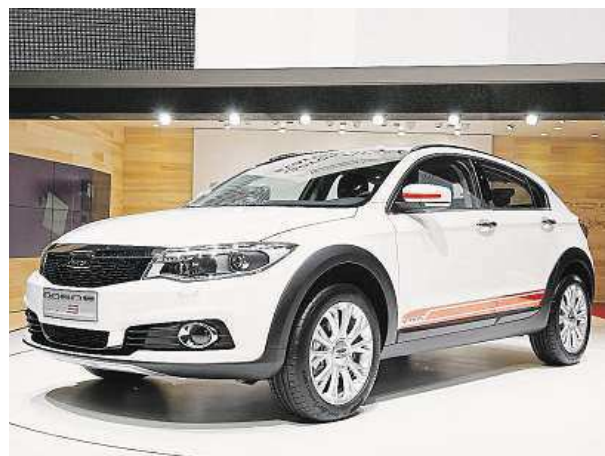
Qoros 3 City SUV se dočkají i na Slovensku.

Že se ale vývoj aut bude i nadále ubírat směrem k SUV, naznačují i zajímavé nejezdící