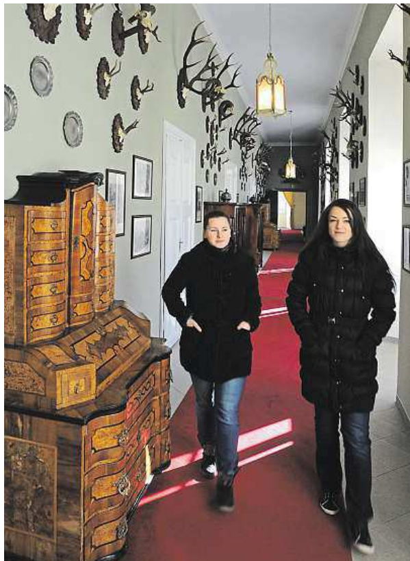
Od konce března můžete navštívit zámek Duchcov.