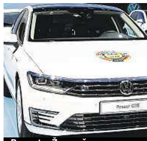
Passat v Ženevě

Letošní titul Auto roku evropských novinářů přišel velkému rodinnému sedanu Volkswagen Passat. Cena byla vyhlášena v předvečer úterního zahájení ženevského autosalonu. Passat zvítězil v souboji s šesti dalšími finalisty včetně Citroënu C4 Cactus, Renaultu Twingo nebo BMW 2-Series Active Tourer. Nový passat se může pochlubit například pokročilejším systémem pro zabránění střetu s jiným vozidlem a dalšími novými technologiemi. HOPE