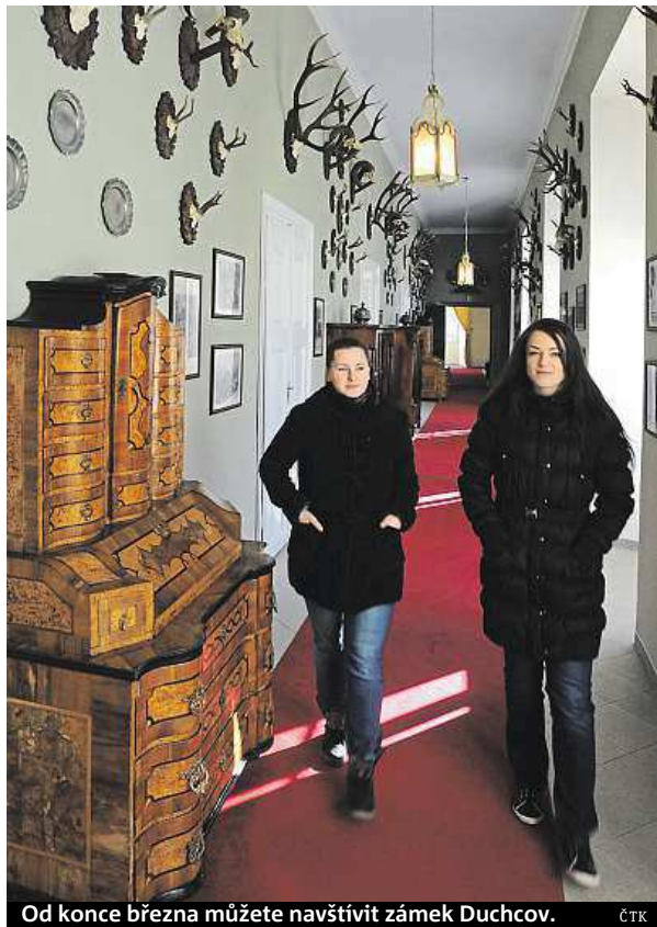
Od konce března můžete navštívit zámek Duchcov.