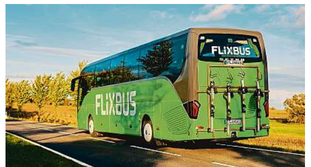
Putování autobusem snižuje v porovnání s letadlem nebo osobním autem uhlíkovou stopu až o devadesát procent.