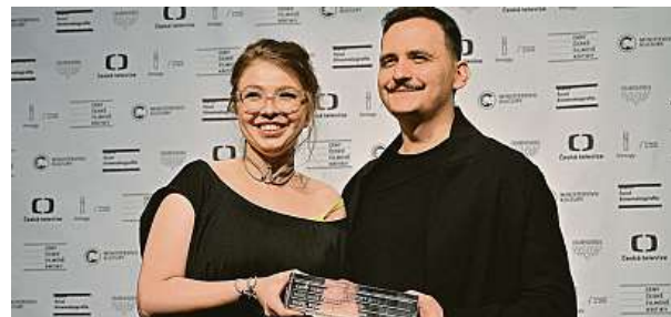
V kategorii Mimo kino zvítězila minisérie #annaismissing.