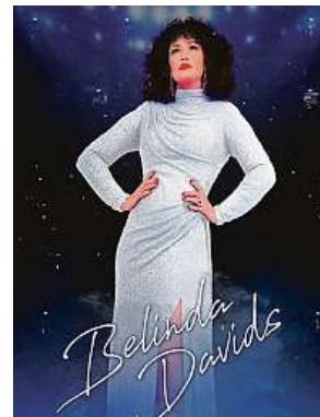
Zpívala ve spoustě hotelů, v klubech a kabaretech.