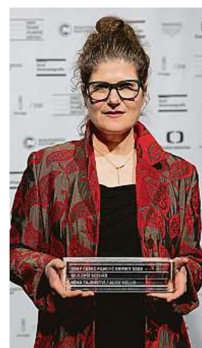
Ceny české filmové kritiky jsou rozdány, jak dopadne udělování Českých lvů?