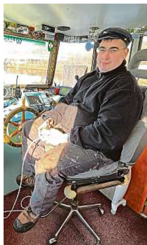
Kapitán lodi Odra má spoustu znalostí a je to navíc skvělý vypravěč. Z jeho „kanceláře“ je úžasný výhled.