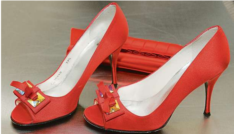
Mezi utajované nákupy u žen patří boty. Některé dámy tvrdí, že ideální je pořizovat je, pokud možno, ve stejném odstínu. Partner spíše nepostřehne, že se jedná o zcela nové obutí.