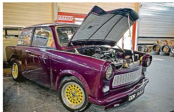
Málkoterá žena tuší, kolik peněz stojí jejího partnera netradiční koníček. Například renovace nebo tuning výjimečného auta.