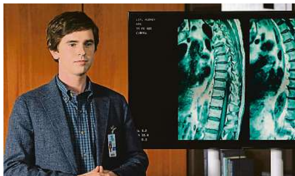
Dobrý doktor má na portálu csfd.cz přes 80 procent. ABC TV NETWORK

Shaun Murphy je začínající chirurg trpící autismem. Prostředí klidného venkova se ale rozhodne v první sezoně vyměnit za práci na prestižní chirurgické jednotce ve slunném kalifornském městě San José. Kromě pomoci pacientům v Nemocnici svatého Bonaventury ale řeší také fakt, že do běžného světa vždycky