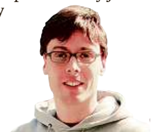
MARDOŠA ČLEN KAPELY TATA BOJS

„ Máme jich dost ještě nepověšených, takže jsou zatím jen postavené, opřené o zeď.“