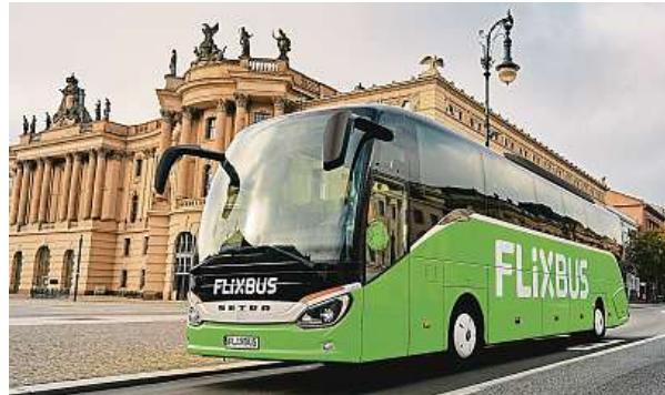
Společnost FlixBus nabízí rychlé a pohodlné spojení do evropských metropolí. Mezi nejžádanější se řadí Berlín.

Evropské metropole lákají turisty k návštěvě celoročně. Kromě unikátní architektury je zde možné objevovat kouz-