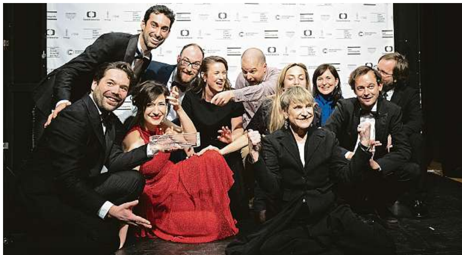
Ceny české filmové kritiky jsou rozdány, jak dopadne udělování Českých lvů?