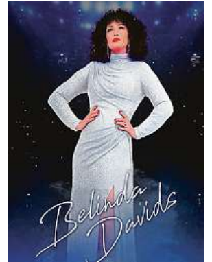
Zpívala ve spoustě hotelů, v klubech a kabaretech.