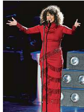
Belinda Davidsová bude opět v Česku. 2x PRSOUIP

Byť jsou si zpěvačky opravdu jak hlasově, tak vizuálně velmi podobné, pro Belindu je prý vždy kompliment slyšet fakt, že jsou jak dvojčata.