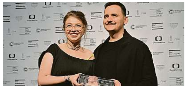
V kategorii Mimo kino zvítězila minisérie #annaismissing.