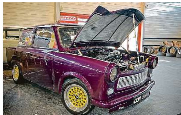
Málodkerá žena tuší, kolik peněz stojí jejího partnera netradiční koníček. Například renovace nebo tuning výjimečného auta.