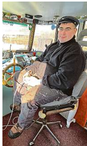
Kapitán lodí Odra má spoustu znalostí a je to navíc skvělý vypravěč. Z jeho „kanceláře“ je úžasný výhled.