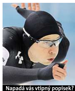
Napadá vás vtipný popisěk?

Napište bublinu a reagujte na sloupek na: www.facebook.com/denikmetro