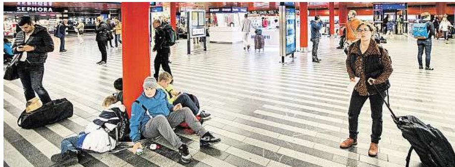
Bude to na hlavním nádraží v Praze vonět po fialkách?