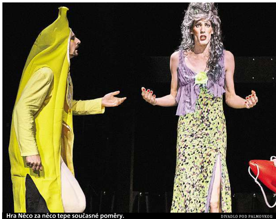
Hra Něco za něco tepe současné poměry.