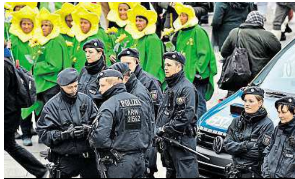
Karnevalové veselí je pod dohledem policistů.

Na slavnosti masek v Porýní dohlédnou i soukromé agentury.