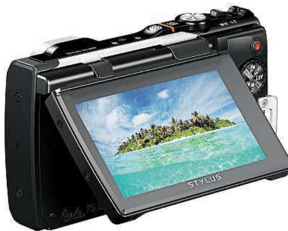
Společník na cestě za dobrodružstvím

Neztratí se rozhodně ani v horách či jiných, často klimaticky nepříznivých oblastech. Mráz do -10 °C ho nechává absolutně v klidu. Navíc se o něj nemusíte bát, ani když