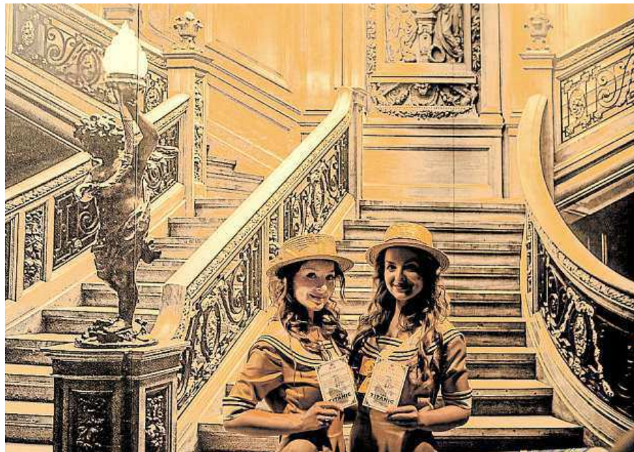
Nezapomenutelné schodiště první schůzky Kate Winsletové a Leonarda DiCapria