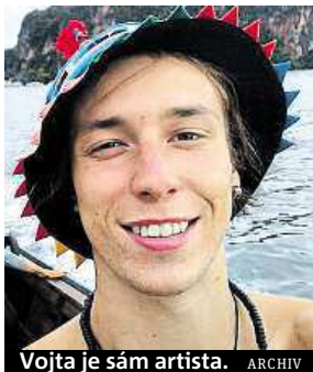
Vojta je sám artista.