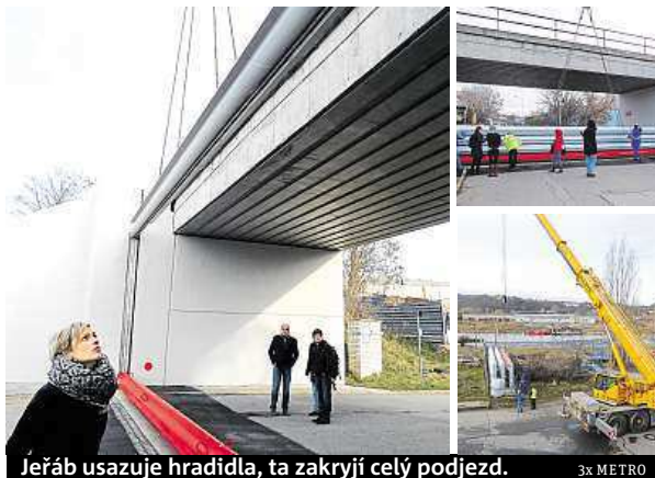
Jeřáb usazuje hradidla, ta zakryjí celý podjezd.

„Už v říjnu jsme zjistili, že objednané práce nebyly provedeny dobře. Voda by totiž v místě, kde hradidlo dosedá na vozovku, prosakovala. Proto radnice požadovala odstra-