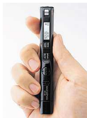
Síkovný záznamník MIRONET

Vzhledem k tomu, že na velké 4GB úložiště je možné uložit skutečně ohromné množství záznamů, rozhodně velmi oceníte možnost je jednoduše spravovat. Veškeré soubory lze roztrždit do oddělených složek, ve kterých stejně snadno budete posléze