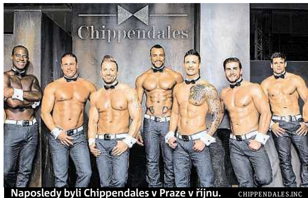
Naposledy byli Chippendales v Praze v říjnu. CHIPPENDALES, INC.