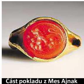
Část pokladu z Mes Ajnak