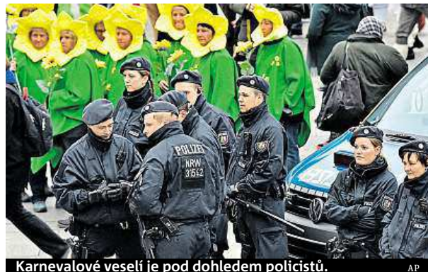
Karnevalové veselí je pod dohledem policistů.

Na slavnosti masek v Porýní dohlédnou i soukromé agentury.