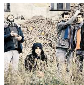
Formace Orlak SPECTACULARE

DERMA MEDICAL CLINIC DEBWA MEDICVIT CLINIC