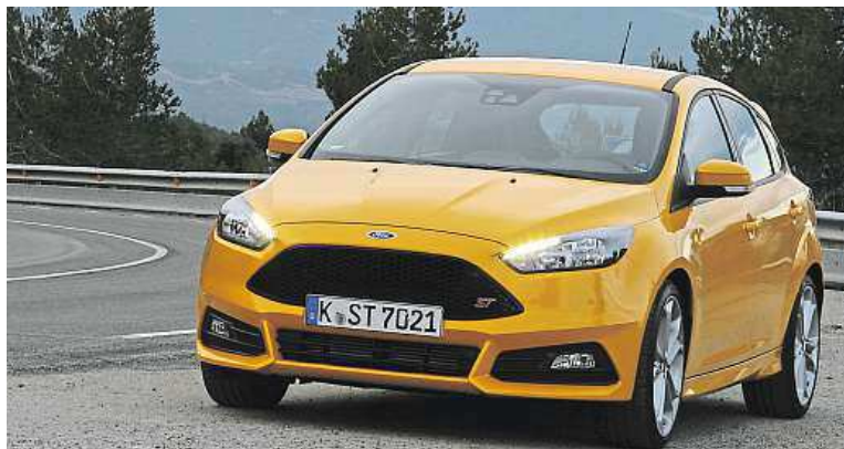
Nový Ford Focus ST začnete na českých silnicích potkávat od dubna. Na fotkách z prezentace ve Španělsku je verze hatchback.