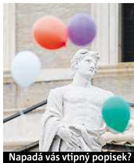
Napadá vás vtipný popisek?

Napište bublinu a reagujte na sloupek na: www.facebook.com/denikmetro