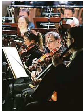
Hudba je rozličná, každému lahodí jiná.