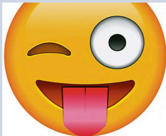
Jedna z neznámějších emodži ikon

jen zvětšuje. Kroužkovci se dočkali zastoupení v roce 2020 přidáním „červa“, který s největší pravděpodobností představuje dešťovku neboli žižalu, a žahavci mají svého zástupce v Emojipedii od roku 2021 díky přidání korálu. ČTK