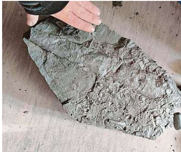
Doklad toho, že byli při ražbě metra nalezeni velcí hlavonožci. Na fotografii je část schránky se zbytky lilijí, mlžů a trilobitů.

Během podzemní ražby tunelů stavební firmy projdou řadou hornin různých souvrství. Sledujeme-li stavbu pravidelně, můžeme si udělat obrázek o tom, jak se postupně směrem ke starším či mladším souvrstvím mění charakter jednotlivých sedimentů nebo jak se mění a nahrazují různá společenstva bezobratlých živočichů. Jedná se vesměs o souvrství, jež jsou jinak v oblasti Prahy nebo i celých středních Čech obtížně přístupná. Lokality jsou často reprezentovány jenom malými zářezy s už zvětralými horninami. Zde je nekonečné množství materiálu, často ve formě obrovských bloků, které po rozštípnání kladivem a dlátem mohou po stovkách milionů let ukázat zástupce dávno vymřelých živočichů. Ale k vaší otázce, díky výtečné spolupráci se stavebními firmami máme v našich depozitářích desítky zásuvek plných různých vzorků. Protože zkameněliny ne-