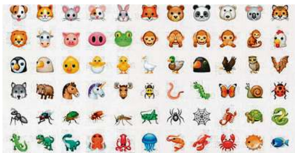
Emodži, které lze v mobilu ve zprávách používat