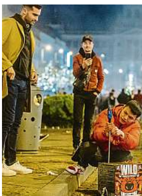
Oslavy nového roku v Praze. Lidé pyrotechniku odpalovali, ačkoli je to zakázáno.

V souvislosti s odpalováním pyrotechniky meteorologové sledují především koncentraci prachových částic PM10 a jemných prachových částic PM2,5. U ostatních látek s platným imisním limitem, které se na stanicích monitorují, se výraznější nárůst neočekával. „Naopak jiné látky, jejichž koncentrace odpa-