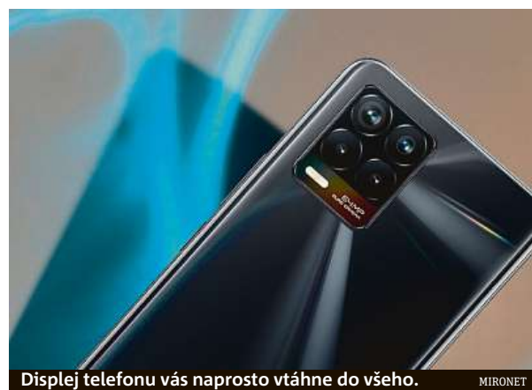
Displej telefonu vás naprosto vtáhne do všeho.

Výkonný a dostupný telefon Realme 8 pořídíte v internetovém obchodu Mironet.cz za 5390 korun.