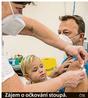
Zájem o očkování stoupá.

proti covidu-19. Ombudsman Stanislav Křeček podle SPD zvaží, že se kvůli očkování obrátí na Ústavní soud, pokud dostane větší množství podnětů. Hnutí SPD se nepodařilo sehnat dost podpisů zákonodárců, aby návrh na zrušení vyhlášky podalo samo. Vyhláška schválená bývalou vládou má od března zavést povinné očkování pro zaměstnance zdravotnických zařízení a studenty zdravotnických oborů, pro pracovníky v sociálních službách, hasiče včetně části dobrovolníků, vojáky a jejich aktivní zálohy, pro policisty a městské strážníky nebo celníky.