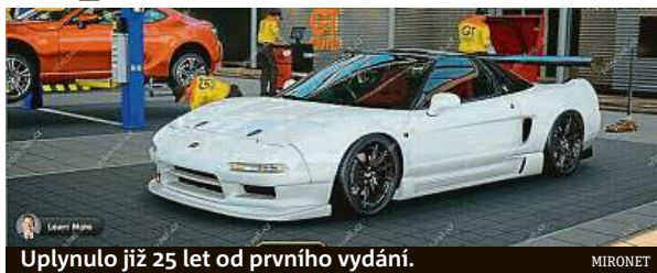
Uplynulo již 25 let od prvního vydání.

Název Gran Turismo je odvozen od velkých výprav, které podnikali lidé v 17. století, když se vydávali na dlouhé cesty po kontinentální Evropě, při nichž se učili a rozvíjeli. Režim kampaň v Gran Turismo 7 bude opět místem, kde se hráči vydají na jedinečné cesty světem Gran Turismo a vytvoří si vlastní individuální zážitky.