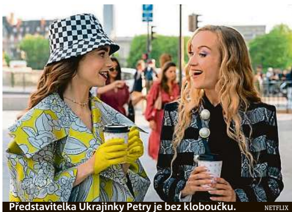
Představitelka Ukrajinky Petry je bez kloboučku.

Na Netflixu běží seriál Emily in Paris , který rozcílil ministra kultury Ukrajiny.