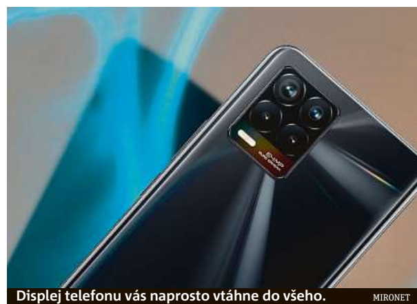
Displej telefonu vás naprosto vtáhne do všeho.

Výkonný a dostupný telefon Realme 8 pořídíte v internetovém obchodu Mironet.cz za 5390 korun.