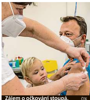
Zájem o očkování stoupá.

proti covidu-19. Ombudsman Stanislav Křeček podle SPD zvaží, že se kvůli očkování obrátí na Ústavní soud, pokud dostane větší množství podnětů. Hnutí SPD se nepodařilo sehnat dost podpisů zákonodárců, aby návrh na zrušení vyhlášky podalo samo. Vyhláška schválená bývalou vládou má od března zavést povinné očkování pro zaměstnance zdravotnických zařízení a studenty zdravotnických oborů, pro pracovníky v sociálních službách, hasiče včetně části dobrovolníků, vojáky a jejich aktivní zálohy, pro policisty a městské strážníky nebo celníky.