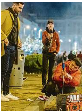
Oslavy nového roku v Praze. Lidé pyrotechniku odpalovali, ačkoli je to zakázáno.

V souvislosti s odpalováním pyrotechniky meteorologové sledují především koncentraci prachových částic PM10 a jemných prachových částic PM2,5. U ostatních látek s platným imisním limitem, které se na stanicích monitorují, se výraznější nárůst neočekával. „Naopak jiné látky, jejichž koncentrace odpa-