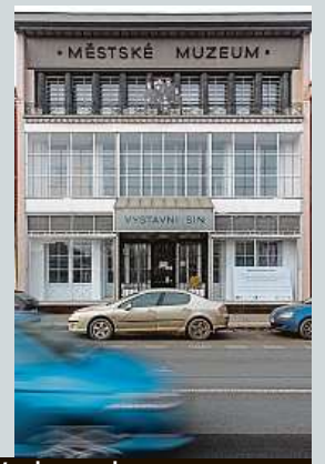
Rekonstrukce historického Wenkeova domu