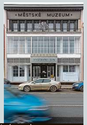
Rekonstrukce historického Wenkeova domu