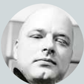
Jakub Stupka Když člověk chce, tak to na něj pasuje.