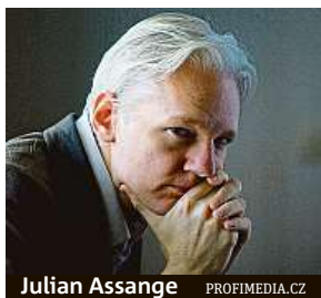
Julian Assange

Britský soud rozhodl, že zakladatel portálu WikiLeaks Julian Assange by neměl být vydán do USA, kde čelí obviněním z porušení špionážního zákona a spiknutí s cílem nabourat se do vládních počítačů. Devětačtyřicetiletému Australanovi by ve Spojených