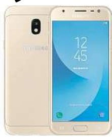
Samsung Galaxy J3 MIRONET

Výprodejová akce v Mironetu se vztahuje i na telefon Samsung Galaxy J3 (2017), který nyní pořídíte o 26 pro-