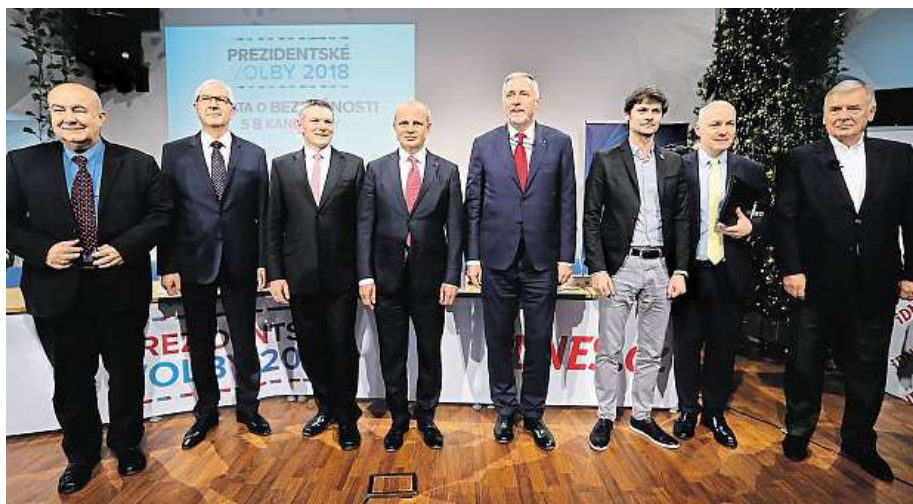
Týden před volbami to konečně začíná jiskřit. Uchazeči volí stále ostřejší slova.