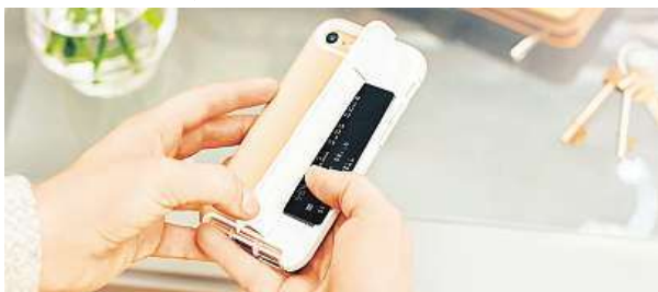
Kryty a pouzdra Tech21 teď pořídíte od 449 korun. MIRONET

Možná jste uhodli, že bude řeč o doplňcích značky Tech21, které se zaměřují na