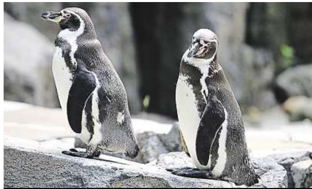
Krmení tučňáků v zoo je vyhledávaná atrakce.

Trojská zoo bude v sobotu nadělovat laskominy. Pochutnají si i zvířecí obyvatelé.