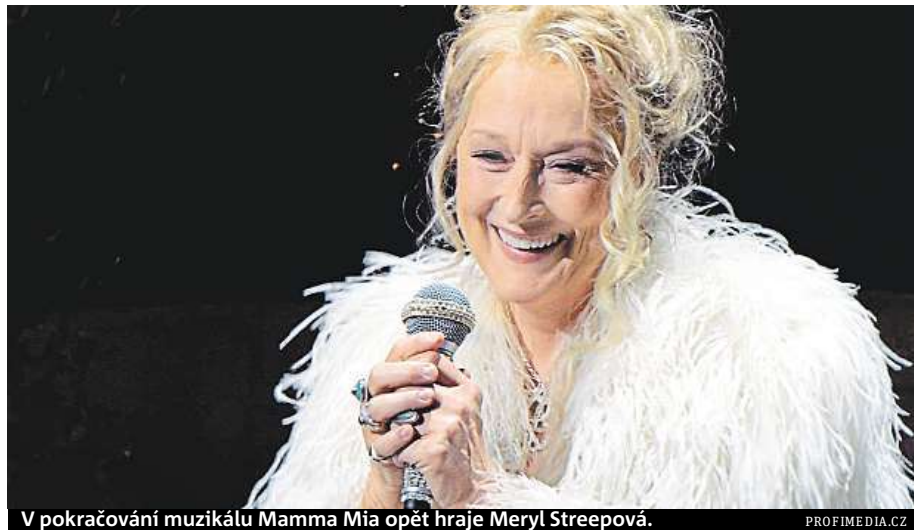
V pokračování muzikálu Mamma Mia opět hraje Meryl Streepová.