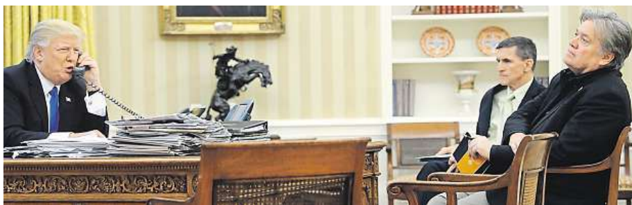
Loni dělal Trumpa s Bannonom (vpravo) jen stůl, teď je mezi nimi mnohem víc.

Když dostal padáka, nepřišel jen o práci, ale i o rozum, napsal Trump o svém někdejší spolupracovníkovi.