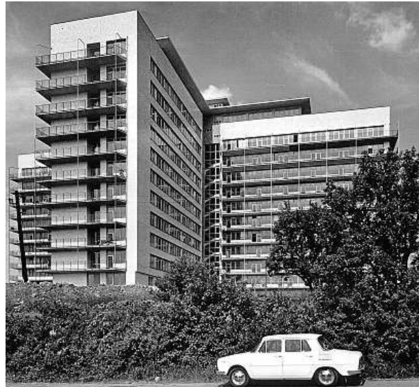
Název Fakultní nemocnice Motol se užívá od roku 1971.

O dekádu později se začala rekonstruovat dětská část, která se během let ocitla v havarijním stavu. Získala nové sály a heliport. Dnes má nemocnice celkem 2189 lůžek (575 dětských), 52 operačních sálů a zaměstnává 5800 lidí (1200 lékařů a 2000 sester). Ročně ošetří přes 900 tisíc pacientů. FILIP JAROŠEVSKÝ, ČTK