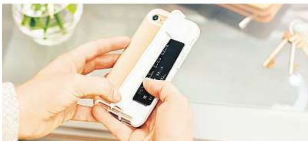
Kryty a pouzdra Tech21 teď pořídíte od 449 korun. MIRONET

Možná jste uhadli, že bude řeč o doplňcích značky Tech21, které se zaměřují na maximální ochranu, zajištěnou revolučním materiálem FlexShock. Ten při pádu telefonu pohltí energii z nárazu a rozptýlí ji tak, aby mobil zůstal nepoškozen. Jak bývá u dobrých vý-