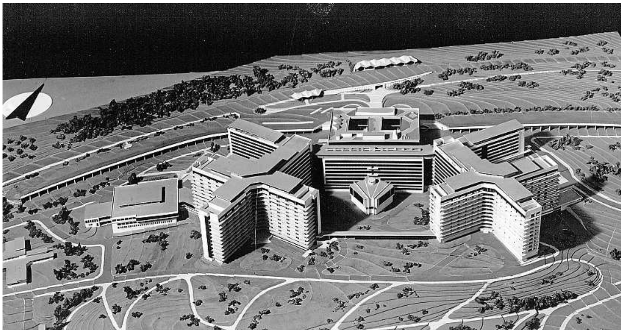
Během let se nemocnice změnila ve špičkové pracoviště. Mimo jiné zde poprvé transplantovali kostní dřeň dětem.

V roce 1958 bylo v tehdejší Městské nemocnici v Motole zřízeno radioizotopové oddělení a záhy přibyla další. Podobu nemocnice se začala výrazně měnit v polovině 60. let, kdy zde začali vězni ve službách podniku Armabeton stavět nový dětský pavilon. Budovaný moderní blok však tehdy spadl pod Dětskou fakultní nemocnici, která sídlila v několika objektech na Karlově a v jeho blízkém okolí. Teprve v lednu 1971 se motolská nemocnice sloučila s fakultní nemocnicí i Fakultou dětského lékařství Univerzity Karlovy,