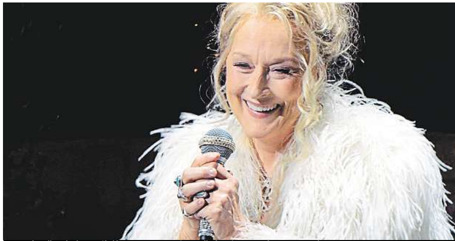
V pokračování muzikálu Mamma Mia opět hraje Meryl Streepová.

Nejen čeští diváci milují animované filmy. 15. června se proto na plátna kin po čtrnácti letech vrátí rodina Úžasňákovi, která bude podle odborníků čílit na miliardu dolarů celosvětově. Druhý díl by měl začínat tam, kde jednička skončila. Zda se však budou chtít o čtrnáct let zpět vracet i diváci, uvidíme až v červnu.