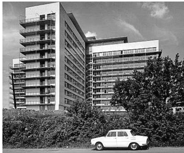
Název Fakultní nemocnice Motol se užívá od roku 1971.

Dnes má nemocnice celkem 2189 lůžek (575 dětských), 52 operačních sálů a zaměstnává 5800 lidí (1200 lékařů a 2000 sester). Ročně ošetří přes 900 tisíc pacientů. FILIP JAROŠEVSKÝ, ČTK