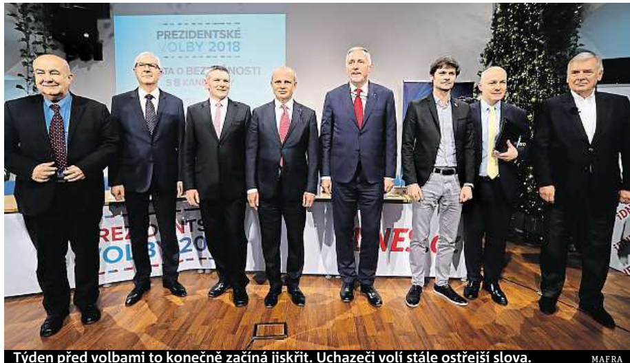
Týden před volbami to konečně začíná jiskřit. Uchazeči volí stále ostřejší slova.