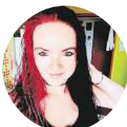
Elli DeNarya V obchodních centrech, jinak si netroufnu.