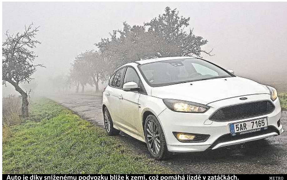
Auto je díky sníženému podvozku blíže k zemi, což pomáhá jízdě v zatáčkách.

Pokud chcete vypadat drsně, ale závodnické geny spíše potlačujete, je pro vás Focus ST-Line jak ušitý.