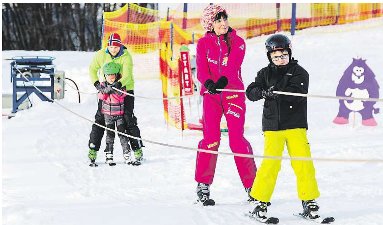
Sněžení a silný vítr od noci na včerejšek komplikují téměř v celém Česku dopravu. Naopak lyžaři mají z nadílky radost.

Zvířata v ohrožení? Po deseti letech se v Česku objevily nové případy ptačí chřipky. Lidé. Podle odborníků v současnosti nejsou v ohrožení. Bezpečnost. Větší chovatele čeká ochranné a dozorové pásmo STRANA 4