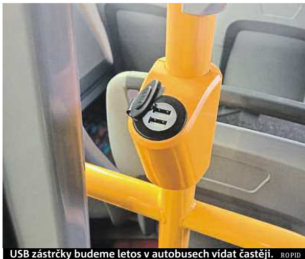
USB zásuvky budeme letos v autobusech vidat častěji. ROPID

Podle mluvčího Ropidu Filipa Drápalu budou nové autobusy příměstských linek již povinně sladěny do standardního červenomodrobílého ka-