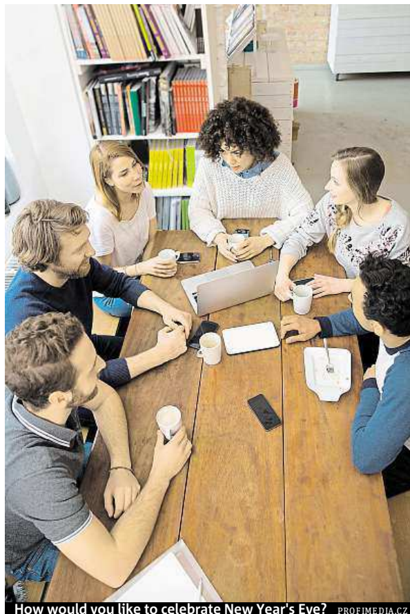
How would you like to celebrate New Year's Eve?