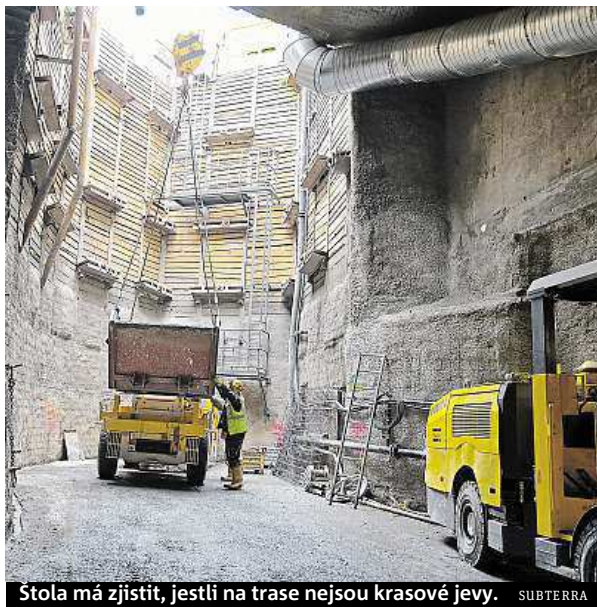
Štola má zjistit, jestli na trase nejsou krasové jevy. SUBTERRA

I když je štola už hotová, průzkum dále pokračuje. „Navrhli jsme, že by bylo vhodné