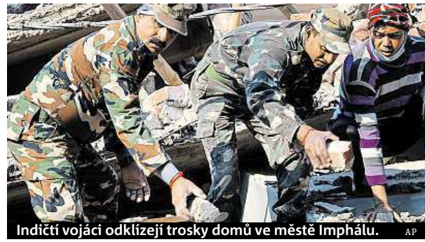
Indičtí vojáci odklízejí trosky domů ve městě Imphálu.

Nejméně devět mrtvých a téměř dvě stovky raněných si vyžádalo zemětřesení o síle 6,8 stupně Richterovy škály, které včera ráno postihlo severovýchod Indie, Bangladéš a Barmu. Americká geologická služba USGS zprvu umístila zemětřesení do Barmy, než upřesnila, že jde o oblast severozápadně od města Imphál, které je správním střediskem indického státu Manipur na severovýchodě země. Otřesy trvaly asi minutu a jsou hlášené vážné škody. Ohnisko zemětřesení bylo v hloubce 57