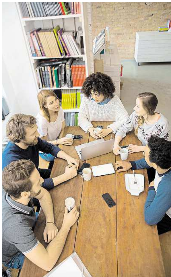
How would you like to celebrate New Year's Eve?