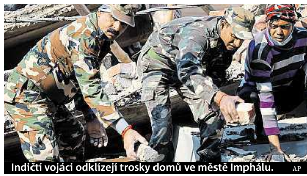
Indičtí vojáci odklízí trosky domů ve městě Imphálu.

Nejméně devět mrtvých a téměř dvě stovky raněných si vyžádalo zemětřesení o síle 6,8 stupně Richterovy škály, které včera ráno postihlo severovýchod Indie, Bangladéš a Barmu. Americká geologická služba USGS zprvu umístila zemětřesení do Barmy, než upřesnila, že jde o oblast severozápadně od města Imphál, které je správním střediskem indického státu Manipur na severovýchodě země. Otřesy trvaly asi minutu a jsou hlášené vážné škody. Ohnisko zemětřesení bylo v hloubce 57