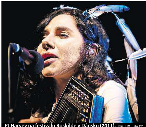
PJ Harvey na festivalu Roskilde v Dánsku (2011).