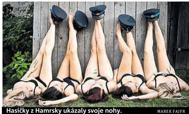
Hasičky z Hamsky ukázaly svoje nohy.