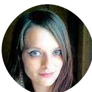
Terorka Sudíková A každý košer výrobek dláždí cestu sionistům!