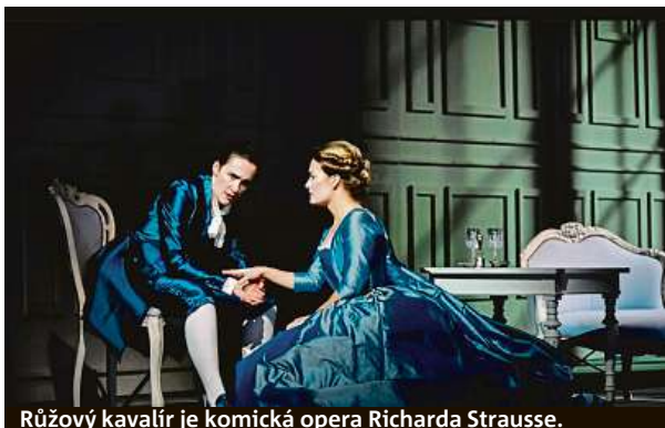
Růžový kavalír je komická opera Richarda Straussa.