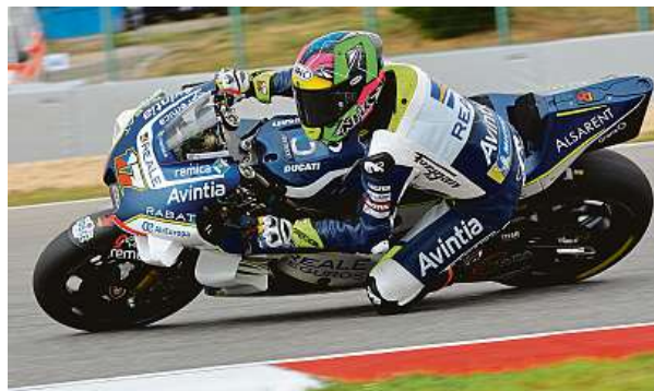
Ceský závodník ve svém živlu

V současné chvíli předpokládá, že vyřazení z MotoGP pro něj znamená zároveň konec kariéry, nebo přinejmenším její přerušování. Zajímavá místa pro příští sezonu jsou totiž v tuto chvíli už dávno rozzebrána, a to platí jak pro krá-