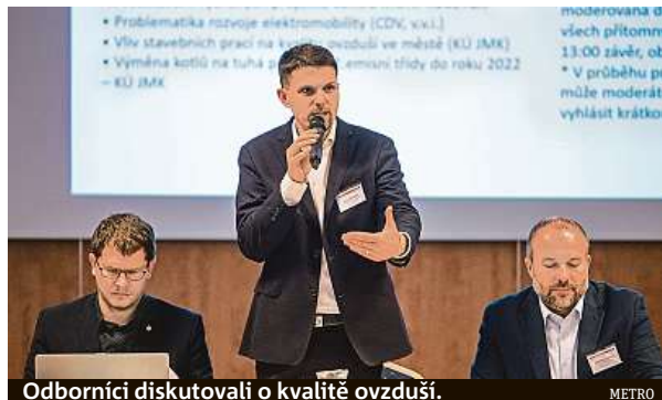
Odborníci diskutovali o kvalitě ovzduší.

Druhým velkým tématem se stalo stavebnictví. Prach ze stavebních prací má na kvali-