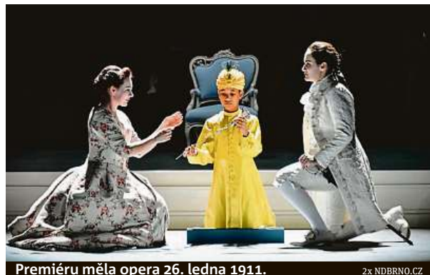
Premiéru měla opera 26. ledna 1911.

Zápletka opery se točí kolem požívačného barona Ochs, který si chce vzít mladou, bohatou dívku. Plány mu překazí fakt, že se jeho vyvolená Sophie zamiluje do Octaviána, jenž jí baronovým jménem předává ceremoniální stříbrnou růži.