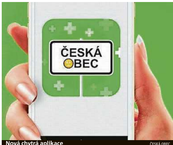
Nová chytrá aplikace

„Na magistrátu jsme začátkem října prezentovali náš nápad zaimplementovat rezidentní parkování do aplikace Česká obec. Dočkali jsme se pozitivní reakce a koncem října už mohli první uživa-