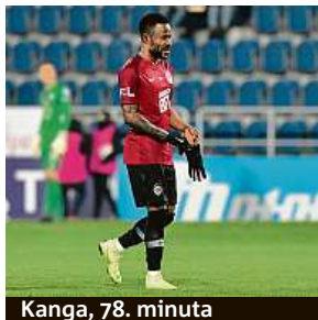
Kanga, 78. minuta