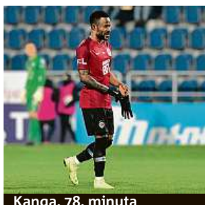
Kanga, 78. minuta