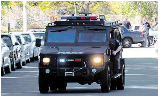
Speciální jednotka míří k místu, kde střelci zabili 14 lidí.

V budově úřadu sociálních služeb, kde se masakr odehrál, se v okamžiku střelby mohli nacházet až 600 osob. Lidé, kteří zde pracují, se starají