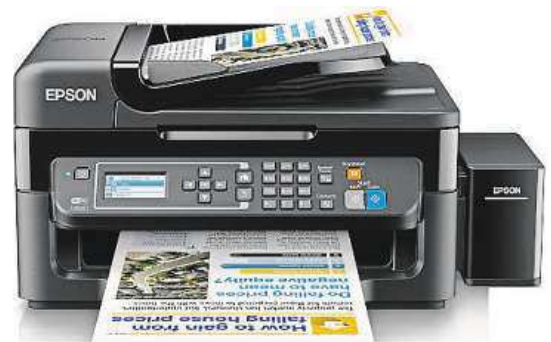
Tiskněte levně a rychle i doma.