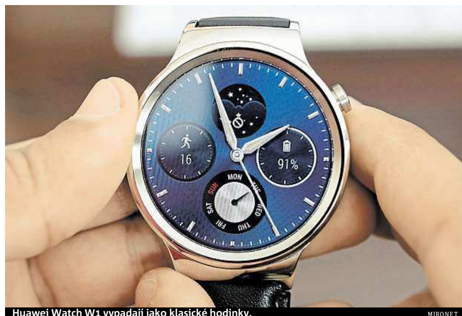
Huawei Watch W1 vypadají jako klasické hodinky.

Hodiny umí takřka vše, na co si vzpomenete, od notifikací příchozích hovorů a zpráv po ovládání hudebního přehrávače. Bez problému je spárujete s telefony s operačním systémem Android i iOS, od verzí 4.3 a 8.2.