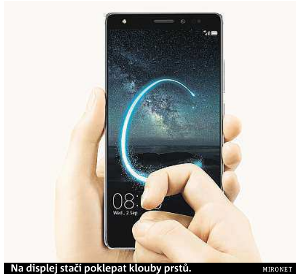
Na displej stačí poklepat klouby prstů.

Tak třeba prostorným 5,5" Full HD displejem s AMOLED technologií pro krásné syté barvy a široké pozorovací úhly.