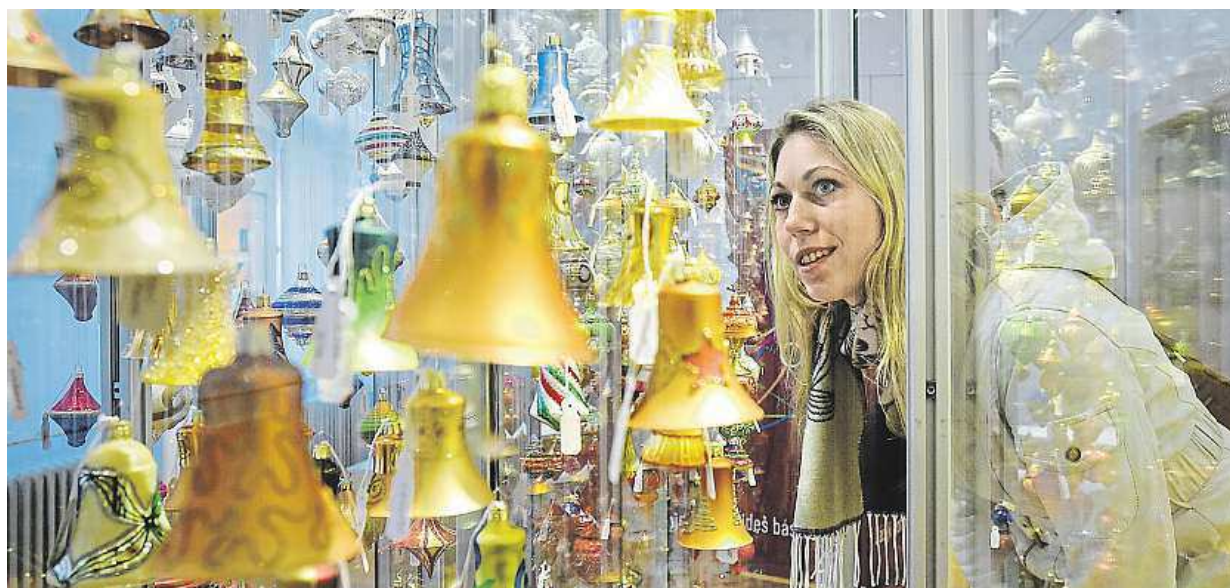
Výstava vánočních ozdob Barevné Vánoce bude v Muzeu skla a bižuterie v Jablonci nad Nisou k vidění až do 24. dubna.

České stravovací návyky. Za 50 let se výrazně změnily. Alkohol. Jeho spotřeba po válce stoupala, teď pro změnu klesá. Loňský rok. Byl ve znamení luštěnin, špenátu a čokolády. Uzeniny. Stále jich jíme moc STRANA 2