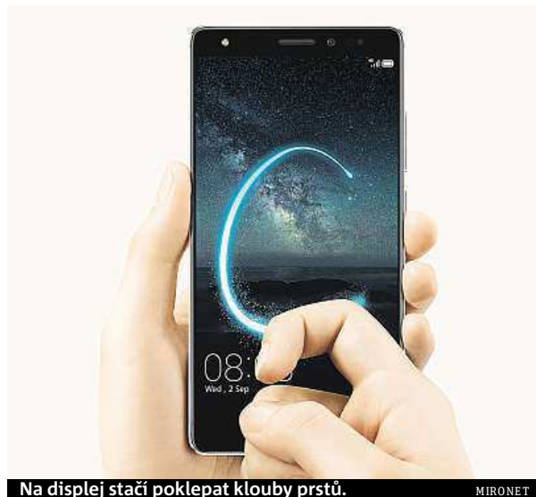
Na displej stačí poklepat klouby prstů.

Tak třeba prostorným 5,5" Full HD displejem s AMOLED technologií pro krásné syté barvy a široké pozorovací úhly.