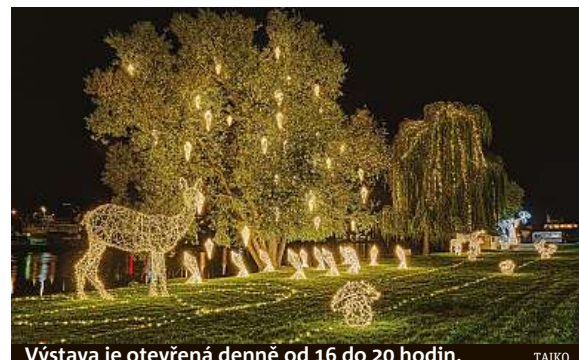
Výstava je otevřená denně od 16 do 20 hodin. TAIKO

Areál v Podolí se od všerejška proměnil ve vánoční park. Expozice je plná zvířat z českých lesů a parků, ale také výjevů z ulic či vánočních symbolů.