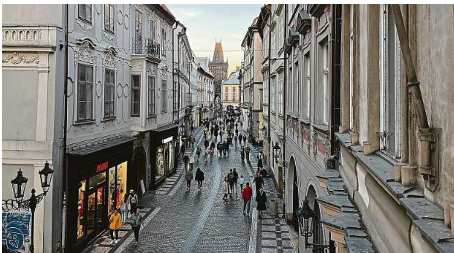
Pohled z Hrzánského paláce do Celetné ulice