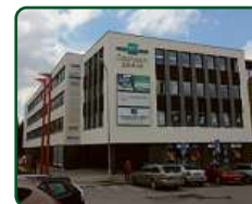
eFi Obchodní Galerie, byty a kanceláře - Jihlava