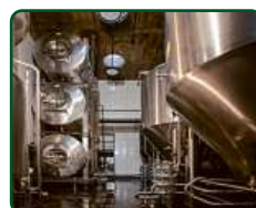
EFI Pivovar, Brno