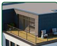
eFi Obchodní Galerie, byty a kanceláře, Jihlava - nástavba