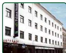
eFi Palace Hotel, Brno, dokončené 2 etapy