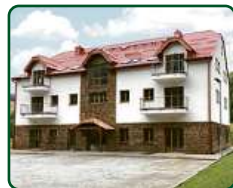
eFi ApartHotel, Horní Lipová, Lipová lázně