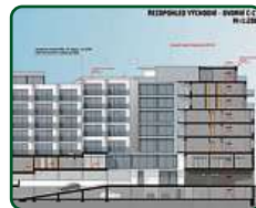
eFi Palace Hotel, Brno, 3. etapa, přístavba