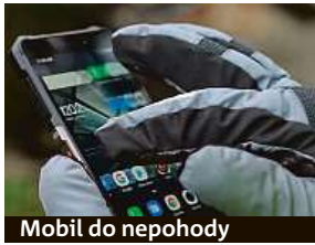
Mobil do nepohody

Ne každý potřebuje nablýskaný sendvič ze skla a železa k telefonování.