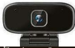
Šikovný pomocník 2x MIRONET

ta z nás se při videohovorech určitě setkala se špatnou kvalitou obrazového a zvukového přenosu. Jenže po webkamerách se okamžitě zaprášilo a zdálo se, že se jich snad už ani nedočkáme. Pokud se již delší dobu po kvalitní webkameře sháníte, v internetovém obchodě Mironet teď najdete žhavou novinku za skvělou cenu.