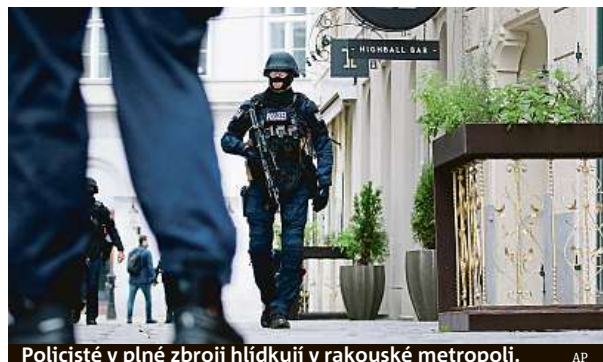
Policisté v plné zbroji hlídají v rakouské metropoli.

Jen několik hodin před začátkem karanténní uzavěry využili obyvatelé k návštěvě divadel a koncertních síní.