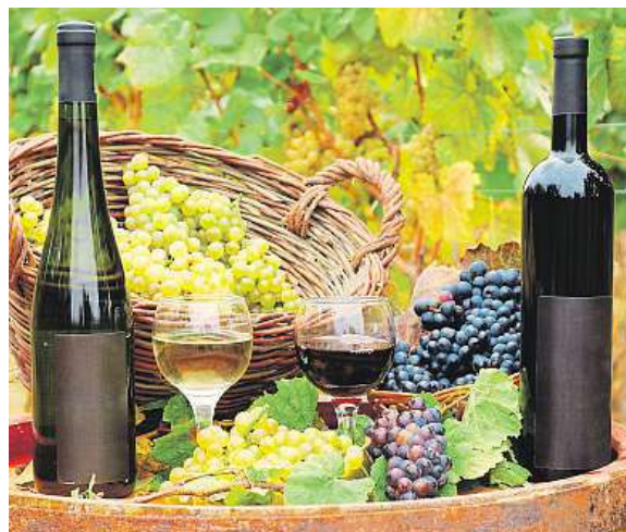
Označení Svatomartinské 2016 má 375 vín.