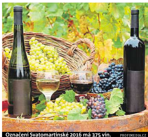
Označení Svatomartinské 2016 má 375 vín.