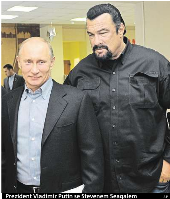
Prezident Vladimir Putin se Stevenem Seagalem

Seagal, který je také zpěvákem a bluesovým kytaristou,