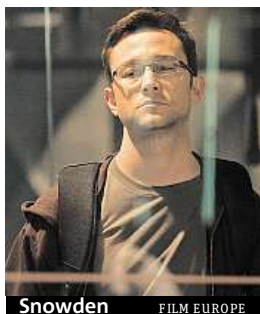
Snowden FILM EUROPE

firmy jako Facebook, Google nebo Apple. Za tento čin mu v USA hrozí pronásledování a exemplární tresty; v srpnu 2013 obdržel v Rusku statut uprchlíka a čerpá dočasný roční azyl následně prodloužený na tříletý. Snowden nyní hledá trvalý azyl v 21 zemích. Premiéra: 10. listopadu