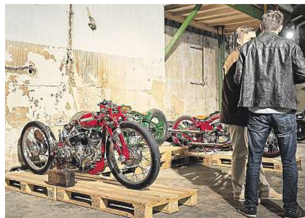
Výstava speciálně upravených motorek