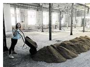
Práce v Továrně. Najdete ji v Dělnické.