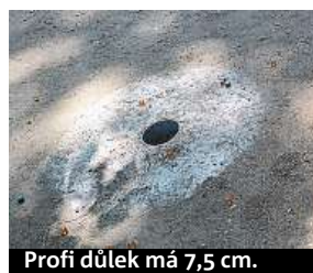
Profi důlek má 7,5 cm.