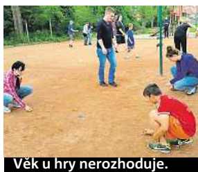
Věk u hry nerozhoduje.