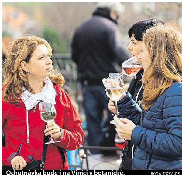
Ochutnávka bude i na Vinici v botanické.

Milovníci vína se mohou těšit především na bílé odrůdy, v hroznech je totiž jak vyšší cukernatost, tak výrazná kyselinka, která moravská bílá vína staví do popředí. U červených vín rozhodne teprve jejich vývoj ve sklepech, v tuto chvíli je však jisté, že budou