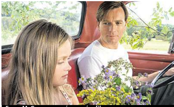
Ewan McGregor ve svém novém filmu