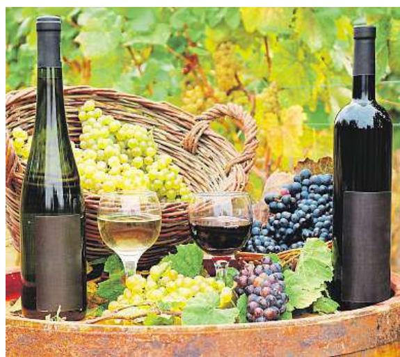
Označení Svatomartinské 2016 má 375 vín.

• U růžových vín a kletů budeme letos vybírat ze 114 vín. Růžových Svatovavříneckých bude 58, Zweigeltrebe 44 a Modrého Portugalu 12. Červených Svatomartinských vín nabídnou vinaři, vinotéky, obchody a restaurace 100; Modrého Portugalu 66 a Svatovavříneckého 34 vín.