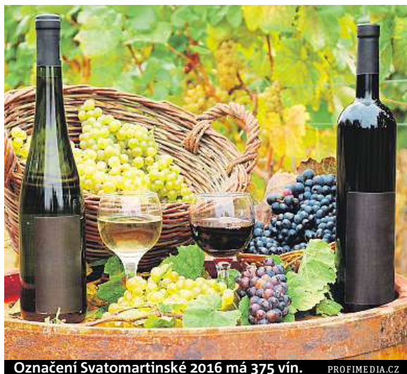
Označení Svatomartinské 2016 má 375 vín.