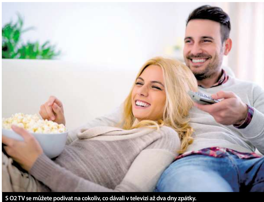
S O2 TV se můžete podívat na cokoli, co dávali v televizi až dva dny zpátky.

Manželka se chce dívat na Ordinaci, ale v Lize mistrů zrovna hraje Barcelona s Arsenallem. V mnoha domácnostech neřešitelný problém a oheň na střechě. Není přitom