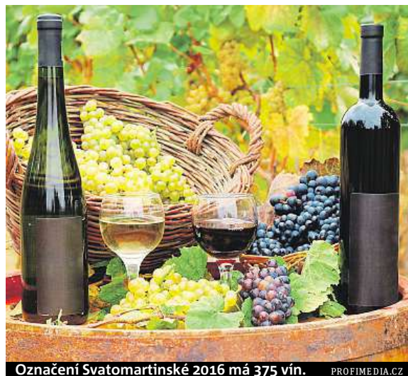
Označení Svatomartinské 2016 má 375 vín.