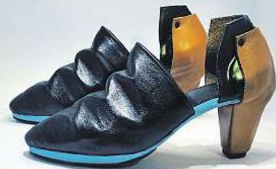
V Kotvě vás čekají i pozoruhodné boty. CZECH DESIGN WEEK

Na stadionu brněnského VUT v neděli od 13 hodin vyvrcholí letošní Národní fieldlakrosová liga finálovým utkáním mezi SKL Jižní Město a LCC Radošín. Vstup na zápas je zdarma. MET