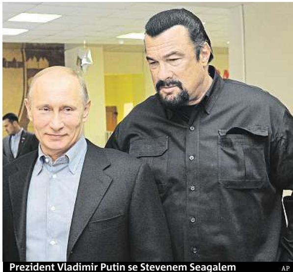
Prezident Vladimir Putin se Stevenem Seagalem

Seagal již počátkem letošního roku získal i srbské občanství. Stalo se tak poté, co koncem loňského roku dvakrát