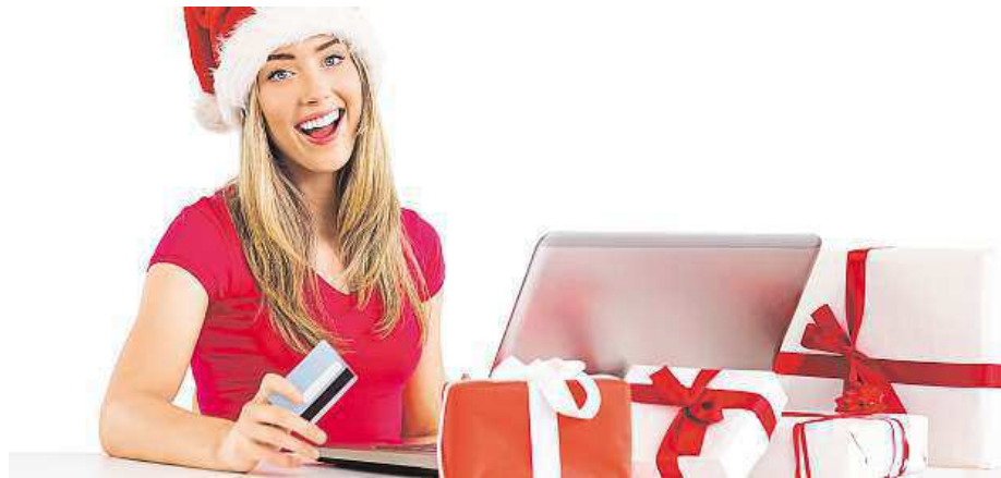
Čím dál více lidí nakupuje vánoční dárky přes internet.

„Čím dál více zákazníků ale dává přednost nákupu našeho vlastního cukroví nebo předpřipravených těst. Naši specialitou je vánoční věnec s rozinkami a mandlemi,“