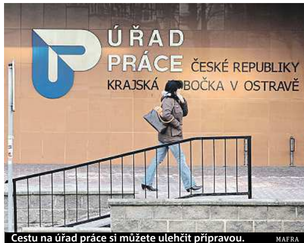
Cestu na úřad práce si můžete ulehčit přípravou.

V případě, že jste už pracovali, je nutno doložit potvrzení o ukončení pracovněprávního vztahu, zápočtový list a potvrzení o výši průměrného měsíčního čistého výdělku