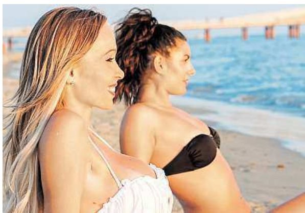
Čeští turisté si letos za letní zájezdy připlatili.

Nabídka pobytů „na poslední chvíli“ byla v červenci a první polovině srpna omezená, neboť na začátku roku vzrostly prodeje zájezdů v re-