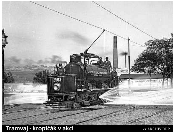
Tramvaj - kropičák v akci