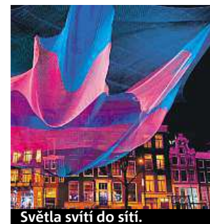
Světla svítí do sítí.

na náměstí Míru. Organizátoři připravili i jednosměrnou trasu pro plynulejší přemísťování. V ulicích bude pomáhat padesát dobrovolníků. Minulý ročník navštívilo přes půl milionu lidí. Více informací najdete na webu www.signal-festival.com . ONDŘEJ NEKOLA