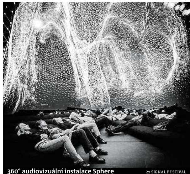
360° audiovizuální instalace Sphere