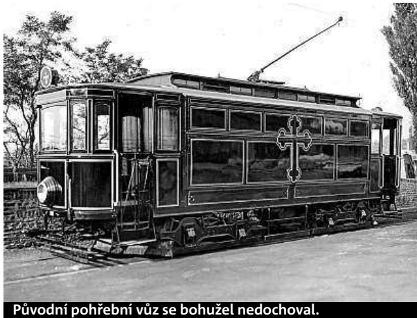
Původní pohřební vůz se bohužel nedochoval.

Když si legendární primátorská tramvaj, vůz s číslem 200, zahrála hlavní roli ve fil-