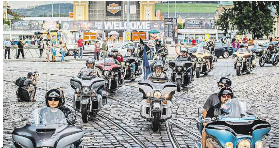
Zítřejší se Praha rozburácí. Městem projede spanilá jízda harleyů. KNOW

První zářijový víkend je v Praze nabitý mnoha akcemi. Ještěrky, motorky, jídlo.