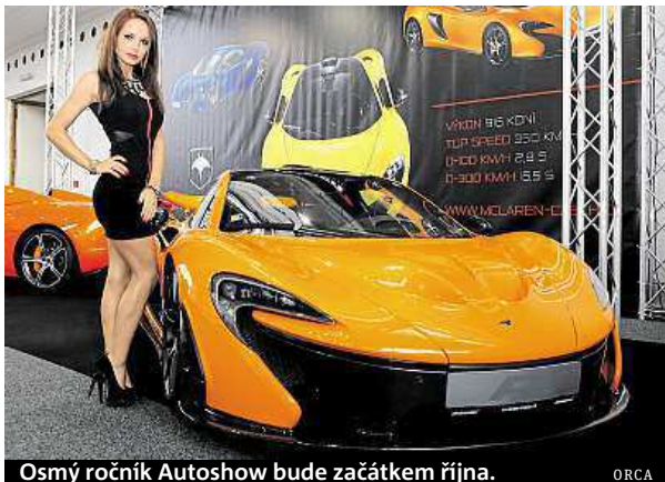
Osmý ročník Autoshow bude začátkem října.

Na jednom místě, převážně v Průmyslovém paláci se tak