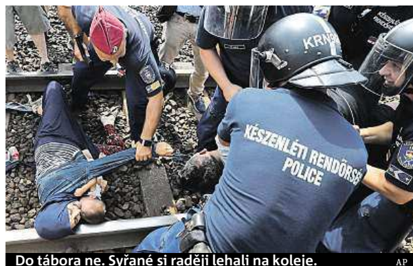
Do tábora ne. Syřané si raději lehali na koleje.