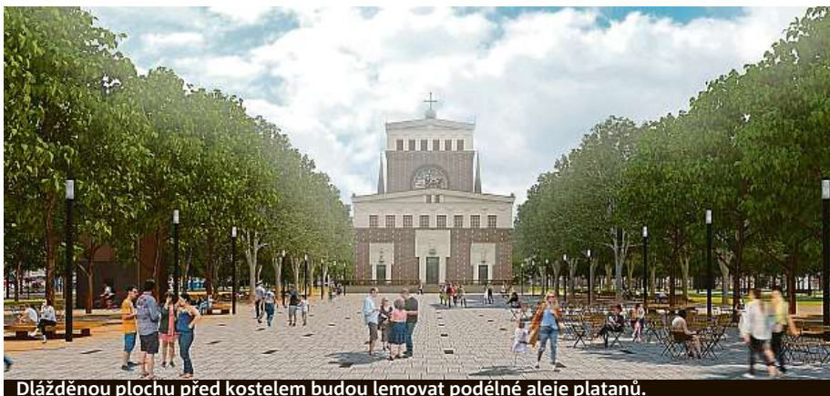
Dlážděnou plochu před kostelem budou lemovat podélné aleje platanů.

Stávající stav náměstí Jiřího z Poděbrad a jeho architektonická podoba vznikaly postupně nekoncepčními úpravami, které probíhaly od sedmdesátých let a v současnosti nevyhovují jeho využití a užívání. Úprava parku neby-