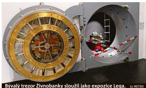
Bývalý trezor Živnobanky sloužil jako expozice Lega.