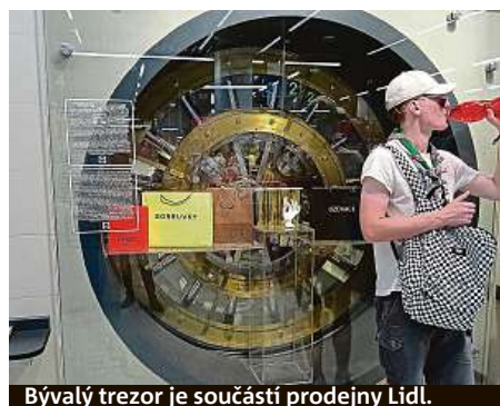
Bývalý trezor je součástí prodejny Lidl.

Pokud ovšem toužíte spatřit funkční trezor, byť bez stohů bankovek, jděte do České národní banky. Od letošního května je dovoleno vstoupit do světa zabezpečeného bohatství každému z ulice. Funguje tady návštěvnícké centrum, kdysi přístupné jen pro VIP nebo předem domluvené exkurze. PAVEL HRABICA