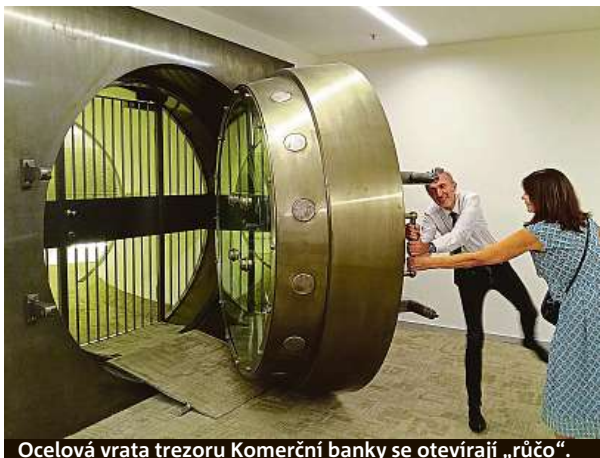
Ocelová vrata trezoru Komerční banky se otevírají „ručně“.