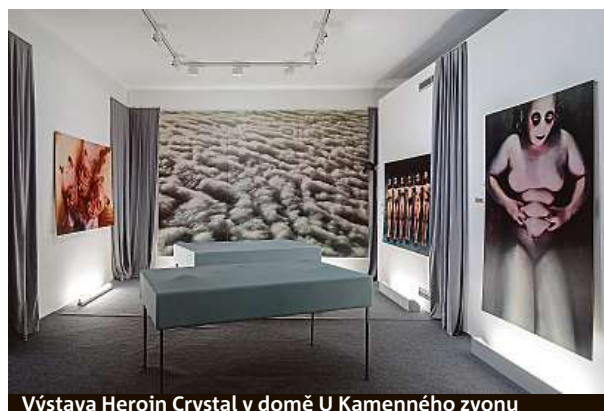
Výstava Heroin Crystal v domě U Kamenného zvonu