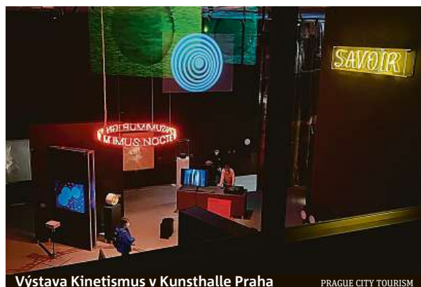
Výstava Kinetismus v Kunsthalle Praha