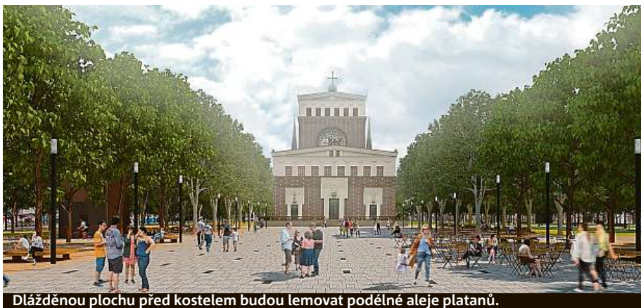
Dlážděnou plochu před kostelem budou lemovat podélné aleje platanů.

Stávající stav náměstí Jiřího z Poděbrad a jeho architektonická podoba vznikaly postupně nekoncepčními úpravami, které probíhaly od sedmdesátých let a v současnosti nevyhovují jeho využití a užívání. Úprava parku neby-