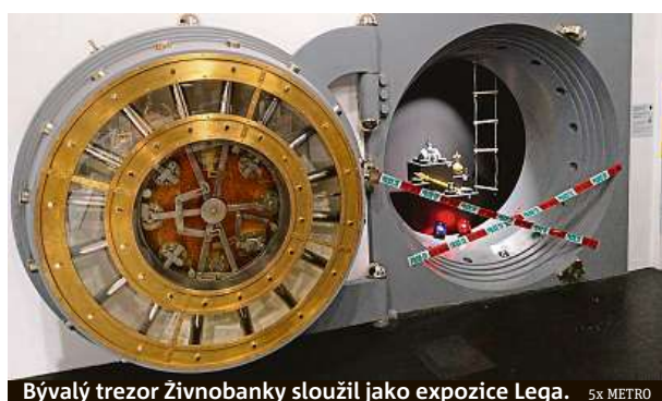
Bývalý trezor Živnobanky sloužil jako expozice Lega. 5x METRO