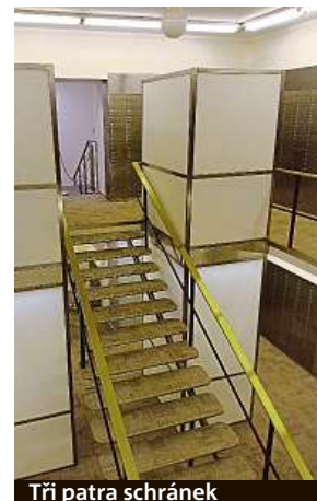
Tři patra schránek

v ulici Na Příkopě nejen Komerčka, ale také třeba bývalý objekt Živnostenské banky. Tam mají možnost obdivovat krásu bývalých trezorů i obyčejní smrtelníci.