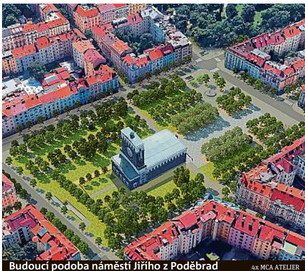
Budoucí podoba náměstí Jiřího z Poděbrad

Po dvaceti letech je konečně rozhodnuto. Už se ví, jak bude vypadat nové náměstí Jiřího z Poděbrad v Praze. Jedna z nejvýznamnějších a nejživějších pražských ploch tohoto typu je v dlouhodobě v nevyhovujícím stavu. Nyní víme, že se nejpozději do konce příštího roku začne proměňovat po vzoru návrhu studia MCA atelier.