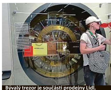
Bývalý trezor je součástí prodejny Lidl.

Pokud ovšem toužíte spatřit funkční trezor, byť bez stohů bankovek, jděte do České národní banky. Od letošního května je dovoleno vstoupit do světa zabezpečeného bohatství každému z ulice. Fun-guje tady návštěvnícké centrum, kdysi přístupné jen pro VIP nebo předem domluvené exkurze. PAVEL HRABICA