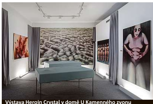
Výstava Heroin Crystal v domě U Kamenného zvonu