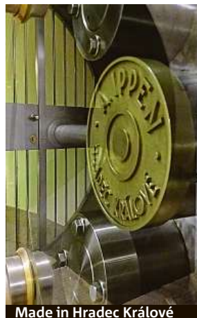
Made in Hradec Králové