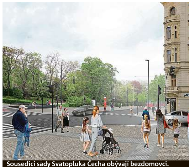
Sousedící sady Svatopluka Čecha obývají bezdomovci.