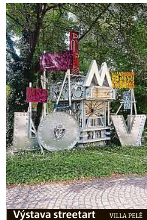
Výstava streetart VILLA PELLÉ

Expozice je plná interaktivních prvků, které budou bavit děti i dospělé. Můžete si vyzkoušet, jak se vyrábí elektřina lidským pohonem nebo si na devítimetrové stěně vytvořit světelné graffiti. MET