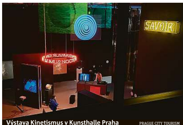
Výstava Kinetismus v Kunsthalle Praha