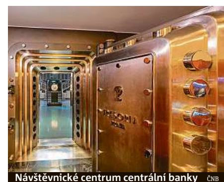
Návštěvnícké centrum centrální banky ČNB