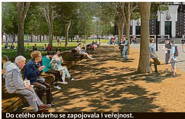
Do celého návrhu se zapojovala i veřejnost.