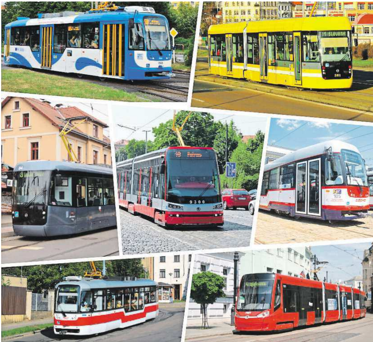
Ostravská Vario LF (vlevo nahoře), plzeňská Vario LF 2/2 IN (vpravo nahoře), liberecká EVO2 (vlevo uprostřed), pražská 15T (uprostřed), olomoucká Vario LF+ (vpravo uprostřed), brněnské Vario (vlevo dole) a bratislavská 30T (vpravo dole)

Pomyslný bronz si z ankety odnesla Praha. Ta dostala od čtenářů 3743 hlasů. Pražský dopravní podnik do soutěže poslal vozy T3 a nejmodernější pražskou tramvaj 15T. Dopravní podnik slibuje, že letos do ulic metropole vyjedou ještě modernější va-