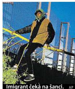
Imigrant čeká na šanci.

Podle francouzských úřadů se však počet běženců, kteří se touto cestou snaží dostat do Spojeného království, během víkendu snížil. Zatímco