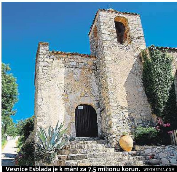
Vesnice Esblada je k máni za 7,5 milionu korun.

Zvyšuje se také zájem o koupi celých opuštěných vesnic. Takových je nyní ve Španělsku asi 3500, z toho 1500 je na prodej. Největší po-