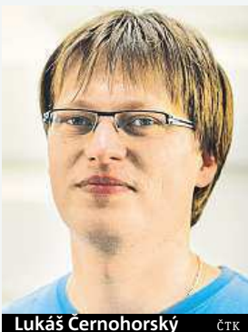
Lukáš Černohorský ČTK

Nejoblíbenější barvou auta mezi tuzemskými motoristy je bílá. Podíl bílých vozů na prodeji nových aut se za poslední tři roky zvýšil z 21 na 29 procent. Naopak podíl dříve dominantní šedé klesl na 14 procent. Třetí nejoblíbenější je modrá. Vyplývá to ze statistiky Svazu dovozců automobilů.