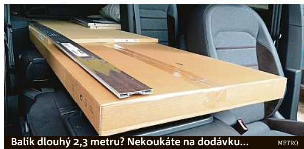
Balík dlouhý 2,3 metru? Nekoukáte na dodávku...

Seat Tarraco disponuje objemem zavazadelníku 760 litrů, při sklopených zadních sedadlech je to dokonce 1775 litrů. Podélný prostor je ale úžasný. Až budete budovat terasu, nemusíte si půjčovat dodávku na převoz prken. HOŘ