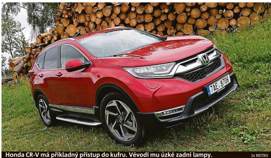
Honda CR-V má příkladný přístup do kufru. Věvodí mu úzké zadní lampy.

Tolik let je model CR-V na trhu. Honda s ním vyrukovala v roce 1995 a za takřka čtvrtstoletí existence model vypracovala v nejprodávanější sportovně-užitkový vůz světa (dle dat společnosti JATO Dynamics). Toto je už pátá generace. Specialitou první verze CR-V byl například rozkládací kempingový stůl na dně kufru nebo to, že se zadní dveře neotevíraly nahoru jako dnes, ale do boku. Hondy CR-V byly vždy ceněny za jízdní vlastnosti v terénu.