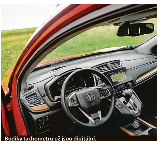
Budíky tachometru už jsou digitální.