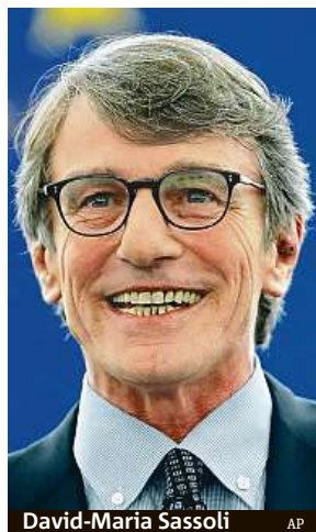
David-Maria Sassoli

Třiašedesátiletý politik italské Demokratické strany ve svém úvodním projevu prohlásil, že EU musí brát ohled na rozdílnost svých jednotlivých regionů. „Nejsme lepší či horší, jsme jen jiní. Měli bychom být na svou rozdílnost hrdí,“ řekl Sassoli. Za své prio-