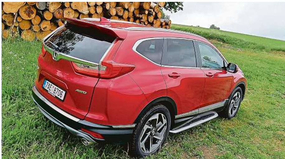
Ačkoli se tvary mezigeneračně nezměnily, stále jde o velmi atraktivní auto.