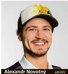
Alexandr Novotný ARCHIV

To zatím není úplně přesně specifikované. Zatím jsme v překlenovacím období, kdy pracují jednotlivé státy na vytvoření on-line systému skrze databázi, kde bude probíhat přezkušování a kde se budou registrovat piloti. Pak získají ID štítek, který si nalepí na svůj bezpilotní prostředek. U vyšších tříd budou muset být drony vybaveny také takzvanými aktivními systémy pro dálkovou identifikaci, aby byly viditelné na mapě kvůli případné identifikaci.