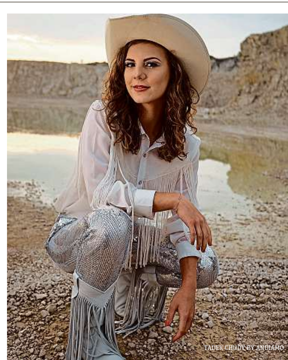
TADER CHUDY BY ANDIAMI