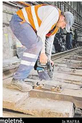
Dělníci musí pražce opravit úplně.