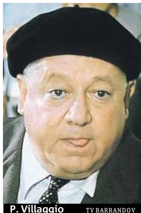
P. Villaggio TV BARRANDOV

Villaggio se narodil 31. prosince 1932 v Janově, a než se dostal k filmu přes kariéru kabaretního umělce, strávil pět let nezázimnou úřednickou prací. Již delší dobu byl podle médií nemocný a naposledy se léčil v římské nemocnici Gemelli. Proslul zejména svými komediálními rolemi. Popularitu získal v sedmdesátých a osmdesátých letech především sérií filmů o bankovním účetním Ugovi Fantozzim, k nimž napsal i námět. Natočil ale i náročnější filmy s významnými režiséry. Hrál například v posled-