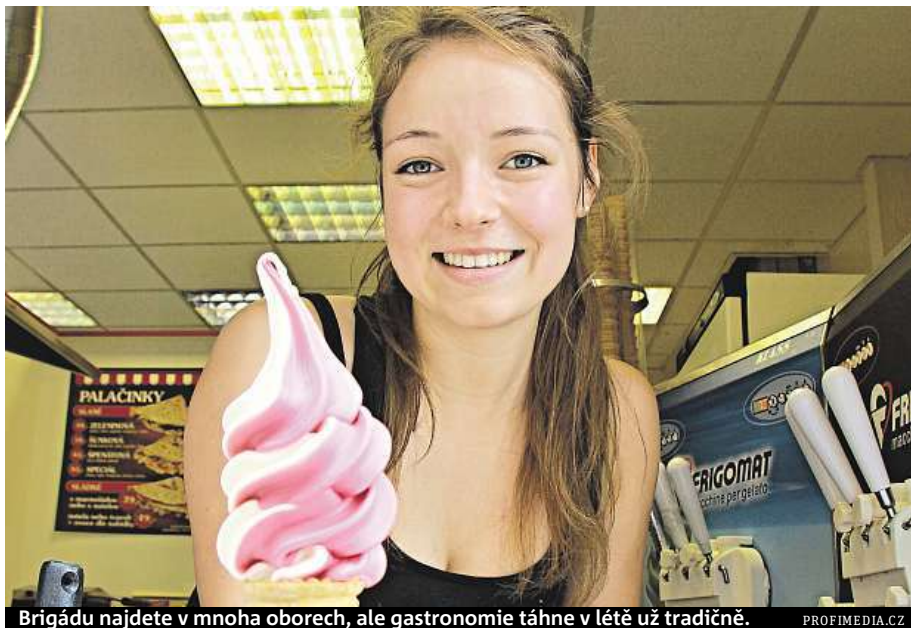
Brigádu najdete v mnoha oborech, ale gastronomie táhne v létě už tradičně.

Nabídka sezonních brigád už dávno přesahuje sezonní práce v zemědělství, prodej zmrzliny nebo obsluhu stánků v rekreačních oblastech. Firmy tak řeší nedostatek stálých zaměstnanců. Brigádníci letos mohou vybírat z nabídky míst ve výrobě, obchodu, v logistických centrech