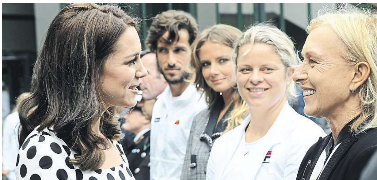
První den Wimbledonu. Vévodkyně Kate pohovořila s bývalou tenisovou hvězdou Martinou Navrátilovou. Více strana 12

Šikana na pracovišti. V Česku ji zažil každý pátý. Nadřizení. Zaměstnance ponižují a snaží se jim dokázat neschopnost různými zákeřnostmi. Co dělat. Polovina postižených má snahu problémy v práci řešit STRANA 2