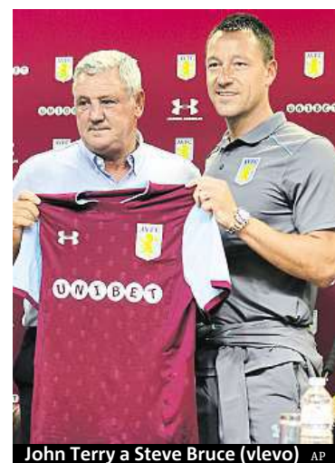
John Terry a Steve Bruce (vlevo)