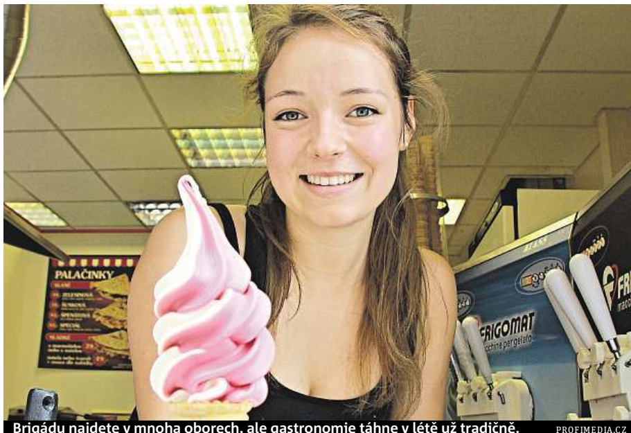
Brigádu najdete v mnoha oborech, ale gastronomie táhne v létě už tradičně.

Nabídka sezonních brigád už dávno přesahuje sezonní práce v zemědělství, prodej zmrzliny nebo obsluhu stánků v rekreačních oblastech. Firmy tak řeší nedostatek stálých zaměstnanců. Brigádníci letos mohou vybírat z nabídky míst ve výrobě, obchodu, v logistických centrech