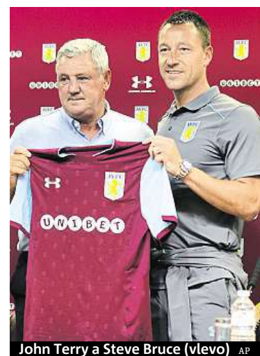
John Terry a Steve Bruce (vlevo)