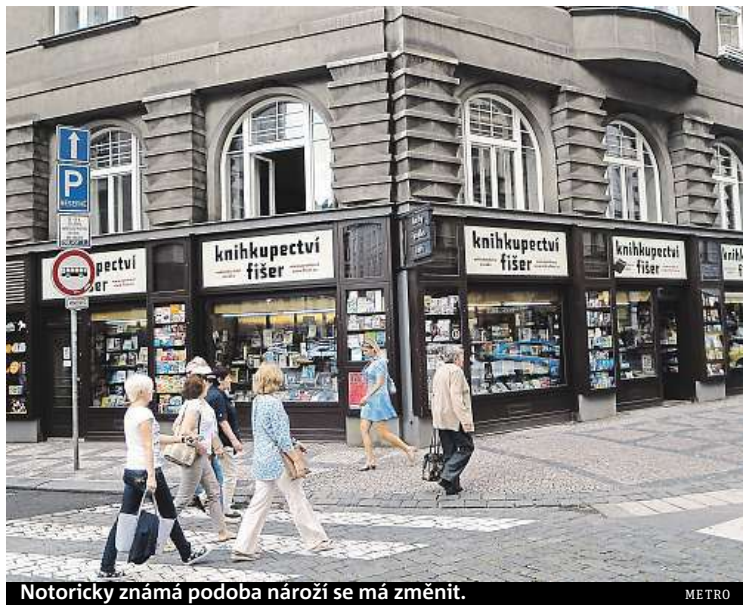
Notoricky známá podoba nároží se má změnit.