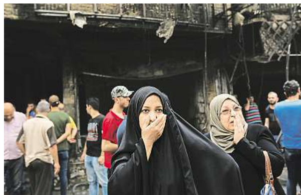
Bombové útoky zasáhly Bagdád v neděli nad ránem.

K jednomu z nejtragičtějších útoků, k nimž došlo v noci na včerejšek v Bagdádu, se přihlásil Islámský stát. V centru města přišlo o život 96 lidí, další stovky jsou zraněny. Druhý atentát, ke kterému se zatím nikdo nepřihlásil, poté ve východním Bagdádu připravil o život pět osob a dalších 16 zranil.