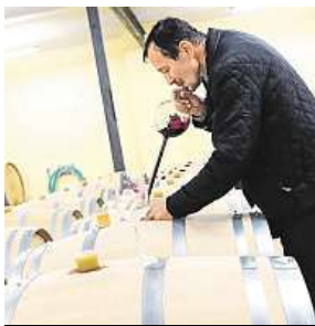
Za pokladem vinařů

„Kolem sklepa je našťestí vždycky co dělat. Opucujete si bečky, natlučete něco do počítače a na ty lidi přinejhorším prostě počkáte,“ směje