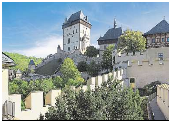
Na Hradozámecké noci bude na Karlštejně ohňostroj. NPÚ

• Konopiště 22.–24. 7. Klub vojenské historie Carnivora – setkání C. a K. jednotek, dobový vojenský tábor, polní ležení s kuchyní, vý-